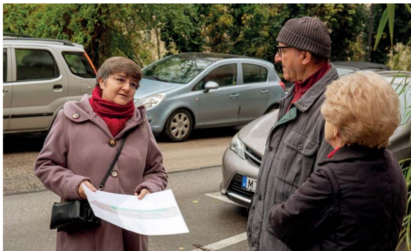
A sorozat tudatosan nem feltétlen szakpolitikai kérdések mentén halad