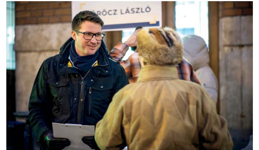
Több mint kétezer-ötszázan töltötték ki a kérdőíveket

A Fidesz nem bírta a véletlenre, hogy mindenki véleményét nyilváníthasson: a kérdőíveket eljuttatták a kerületi postaládákba, az érdeklődők pedig a folyamatos kitélepüléseken, a kerületi Fidesz- és KDNP-irodában és online is kitölthették