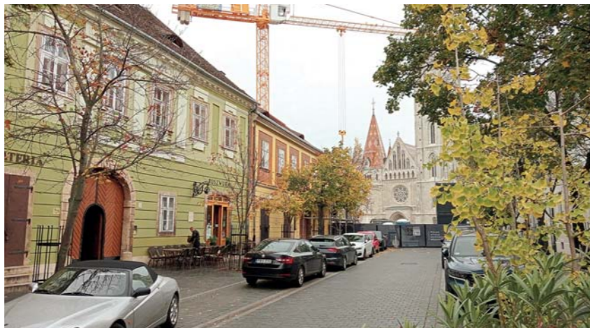
A Ruszwurm terasza egy őszi reggelen

„A 2023. október 9-én az Indexen megjelent tényfeltáró cikkben a Ruszwurm Kft. ügyvezetője súlyos korrupciós vádakat fogalmazott meg V. Naszályi Mártával szemben. Elmondása szerint 2019-ben, az önkormányzati választási kampányt megelőzően a jelenlegi polgármester 20-30 millió forintos kampánytámogatást kért azért cserébe, hogy a megválasztása esetén elsimítsa a cég és az önkormányzat közötti jogvitát” – idézte fel az ügy sajtóvisszhangját az előterjesztő jobboldali képviselők nevében Gulyás Gergely Kristóf a november 9-i testületi ülésen. Ennek érdekében a bizottság vizsgálná az önkormányzat és a Ruszwurm közötti, 2014 utáni peres eljárásokhoz kapcsolódó dokumentumokat, az esetleges szerződéseket, és hogy történt-e olyan egyeztetés a két fél között, amely hivatalosan nem jelent meg az önkormányzat könyveiben. A feltételes mód még november folyamán azért volt indokolt, mert az eredetileg harmadik tagnak felkért Molnárka Gábor momentumos képviselő nem vállalta a bizottsági munkát. Szerinte a vizsgálóbizottság „egy kamu sztori felhabosítása”. Gulyás Gergely Kristóf akkor úgy reagált: „Ha az ügyben senkinek sincs takargatnivalója, akkor mind a kerületi, mind az országos közvéleményt meg tudjuk nyugtatni. Ellenkező esetben pedig tartozunk azzal a választóknak, hogy feltárjuk a közérdek sérelmét.”