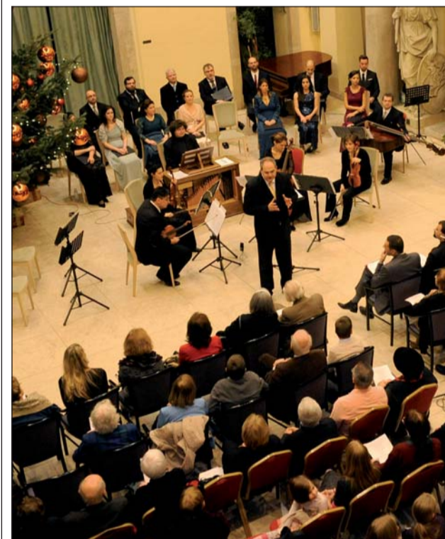
Az Orfeo Zenekar és a Purcell Kórus adott nagyszerű koncertet Advent második vasárnapján

Az adventi délután házigazdája arra hívta fel a figyelmet, hogy a feldíszített karácsonyfa árnyékában a hangverseny hallgatói szerencsésnek mondhatják magukat, hiszen a világ más pontján a hitükért üldöznek embereket. Térben és időben is drámák és tragédiák kötődnek e naphoz. Éppen hatvan évvel korábban, 1956. december 4-én Budapesten asszonytüntetés tartottak. Fegyvertelen nők, anyák, nagymamák vonultak a Hősök terére és virágokkal borították az ismeretlen katonák sírját. Két nappal később, 6-án a Nyugatinál a rendőrök a tiltakozó tömegbe lőttek. Nem sokkal később kiderült, hogy a melbourne-i olimpián résztvevő magyar csapat tagjai közül számosan úgy döntöttek, hogy nem térnek vissza. Ugyancsak december elején, 8-án a munkástanácsok érkeztelen Marosán György, miután Salgótarjánban hiába próbálta rákényszeríteni akarát a helyi munkástanács küldöttségére, kimondta az elhíresült mondatot: „Mától kezdve lövünk”. Salgótarjánban még aznap 131 áldozatot követelő sortűz dördült. -1956-ban a karácsony négy napos ünnep volt. Kijárási tilalmat rendeltek el, amelyet azonban az éjjeli mise idejére felfüggesztettek – emlékeztetett dr. Nagy Gábor Tamás, majd e szavakkal zárta köszöntőjét: -Adventkor keressük a fényt, erre ad lehetőséget a muzsika, a művészet. Keressük azt a fényt, amikor a legsötétebb órában a fény megszűnik.