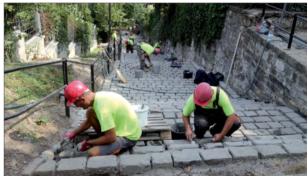
Újrakövezték a Kagyló lépcsőt is

◆ A hatékony és tervezett gazdálkodás eredménye az is, hogy – ellentétben sok más kerülettel – a Budavári Önkormányzat már decemberben elfogadja a 2017-es költségvetését?