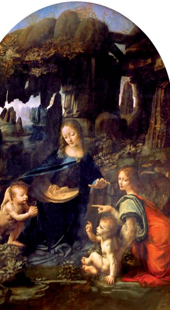
Leonardo da Vinci: Siklás Madonna

Hatvan évvel ezelőtt egy cserbenhagyott nemzet a szovjet tankok árnyékában is várta a fényt. Vajon hogyan tudtak ünnepelni a rettegésben élő családok, amelyekből majdnem mindenhol hiányzott valaki? Legfeljebb csak álmodhattak szabadságról, melegségről, biztonságról. 1956 karácsonya mégis tiszta volt és reményteljes. Mert a puritán körülmények, a féltés sokkal közelebb hozta azt a bizonyos betlehemi éjszakát,