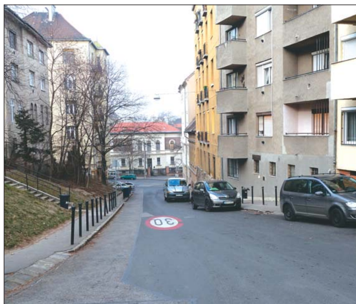
Folytatódik a Naphegy utca felújítása

A költségvetésben többek között szerepel a Ponty utca Szalag utca - Fő utca közötti szakaszának felújítása, hiszen az útburkolaton jelentős süllyedések vannak, a szegély több szakaszon sérült. Tervezik a Halász utca útburkolatának cseréjét is a rakpart és Fő utca között. Itt - a tervek szerint - kiszélesítik a meglévő járdát is. A Franklin utcában sor kerül a lépcsős járda megújítására a Donáti utca és Toldy utca közötti szakaszon. Folytatódik a Naphegy utca felújítása is, 2017-ben a Mészáros utca-Orvos utca közötti szak-