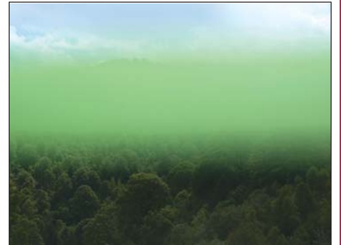
Christiane Peschek: Néma csendben tűntél el

A Várkok Project Room kiállításán Christiane Peschek osztrák fotográfus installatív fotóművészeti projektjét tekinthetik meg a látogatók. A kiállítás 2017. január 21-ig látogatható.