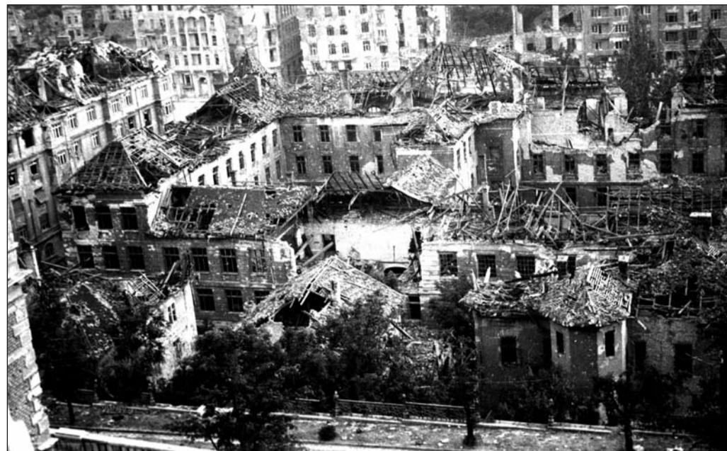
A Krisztinaváros romos épületei a Budai Várból nézve

Budapest 1944-1945-ös ostroma a legvéresebb városostromok közé sorolható. A városban rekedt polgári lakosság az ostrom alatt, illetve annak elhúzódása miatt kénytelen volt elviselni a minden korábbi mértéket meghaladó nélkülözést. Az átlagnapi 3-4 légiáradót fölváltotta az állandó fegyverpogás. Tudomásul kellett venniük, hogy házaik, otthonaik napok alatt hadszíntérre, majd rommá váltak. Az utcákon mindenütt lótetemek hevertek, a közterek és a parkok temetőkké váltak. Sem a német, sem a szovjet alakulatok nem kímélték a várost.