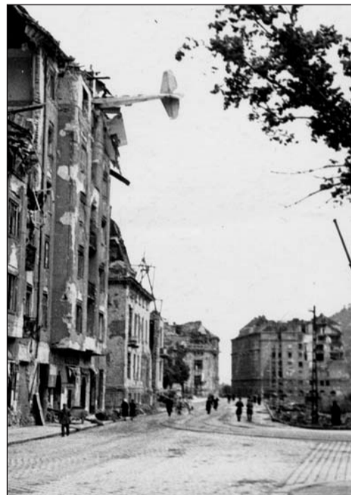
A repülőgép az Attila út 35. számú épületbe csapódott be

A 10-esbe óvóhelyen egy anyja az éjjel sötétségben véletlenül párnával agyonnyomta 4 hónapos gyermekét.