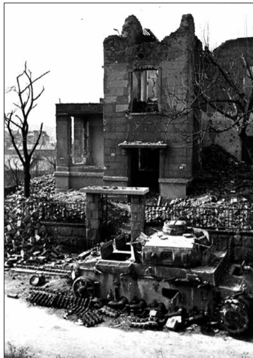
Tigris utca 19.