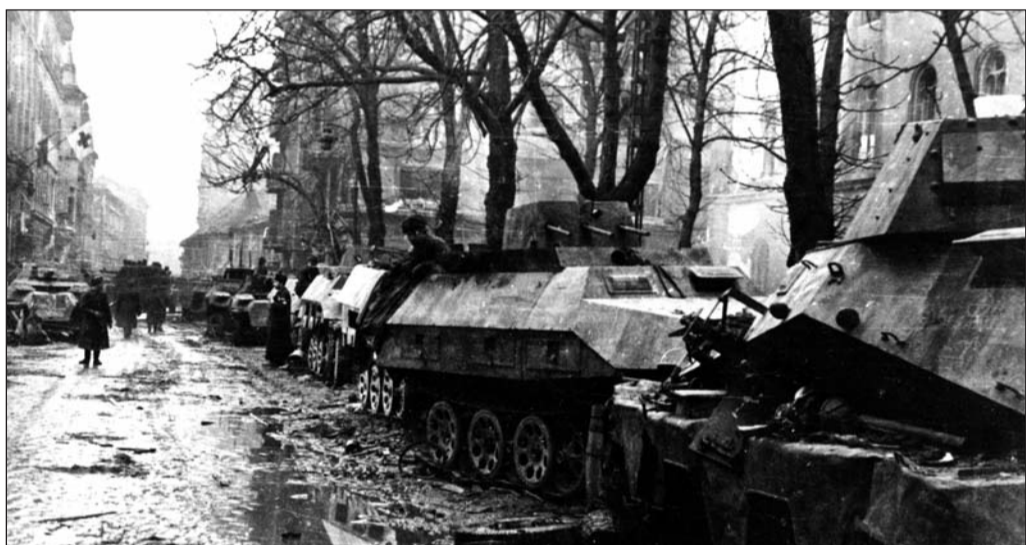
A Fő utca a Halász utcából a Clark Ádám tér felé nézve