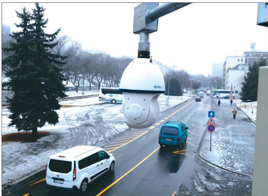
Térfigyelő a Dózsa György térenél

A tapasztalatok alapján a Budavári Önkormányzat az idei évben újabb modernizációt hajt végre: a legmodernebb, IP-alapú rendszert építik