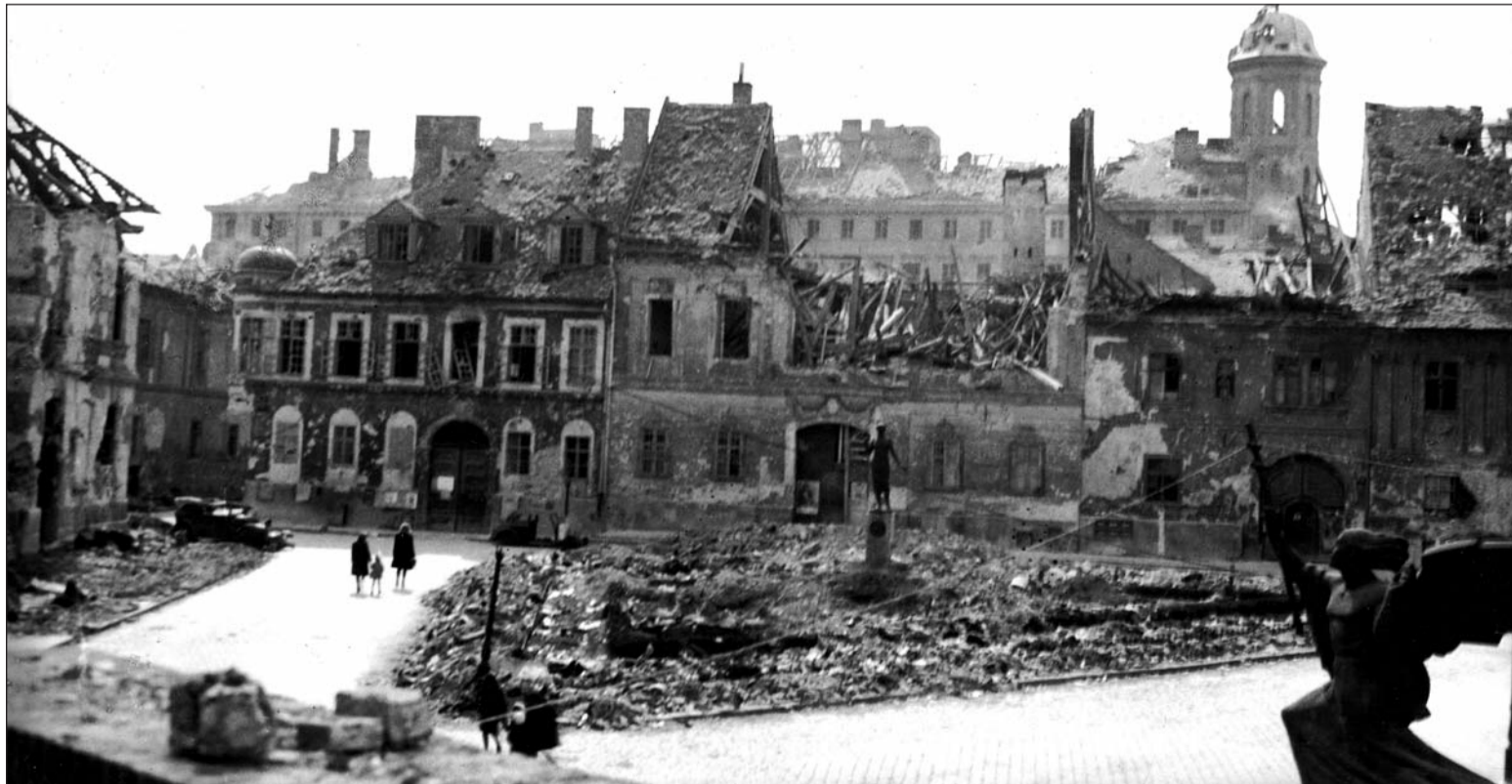
Bécsi kapu tér

Éjjel-nappal hallottuk az ágyúsózt, bombázást. Elképzeltük, hogy mekkora lehet a pusztítás. De amit aztán később az ember a szemével látott, azt nem tudta előre elképzelni. Házsorok, terek, utcák tűntek el, város helyett hóba-sárba-földbe taposott romok, hullák, dögök, roncsok mindenütt.