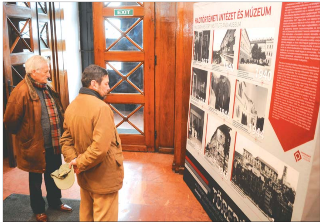
A háború pusztítását mutatja be az amerikai hagyatékából rendezett kiállítás a Hadtörténelmi Intézet és Múzeumban