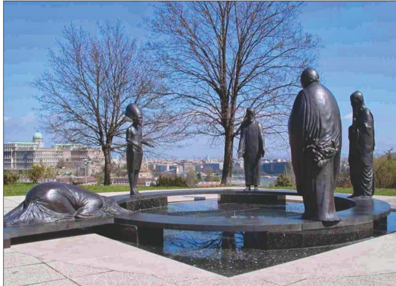
A Filozófiai kert ideális célpont egy kellemes sétához

Tél vége felé sokan panaszkodnak fáradtságról: kimerülten ébrednek, kevés munka után is túlterheltnak érzik magukat. Mindez rányomja bélyegét a hangulatunkra, mentális állapotunkra is. Ennek oka, hogy szervezetünk energiataralékai kezdenek kiapadni, a hosszú téli időszak alatt feléltük vitamin és ásványi anyag tartalékainkat. Összeállításunkban néhány egyszerűbb, a hétköznapokba is könnyen beépíthető javaslattal segítünk a tél végi feltöltődéshez.