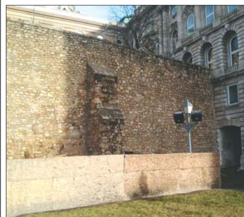
A Stöckl-lépcső helye és a látványterv az újjáépítés utáni állapotról