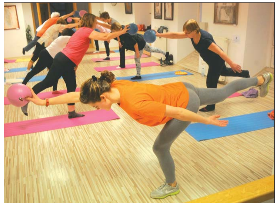
Labdás torna a Vízivárosi Klubban