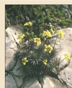
Kövir daravirág

Érdemes felkeresni a Sas-hegyi Látogatóközpontot és a tanösvényt is, igaz csak márciusban nyitnak. Megközelítés: a 8-as autóbusszal a Korompai utcáig, vagy Széll Kálmán térről az 59-es villamossal a Farkasréti temetőig. A Budai Sas-hegy Természetvédelmi Terület különleges természeti értékeket őriz, a 30 hektárnyi védett terület valóságos „élő múzeum” a lakóházakkal beépített hegy tetején. A kilátóból csodálatos panorámában gyönyörködhetünk, s kristálytiszta időben akár a Mátra csúcsait is láthatjuk. További információ: dunaipoly.hu.