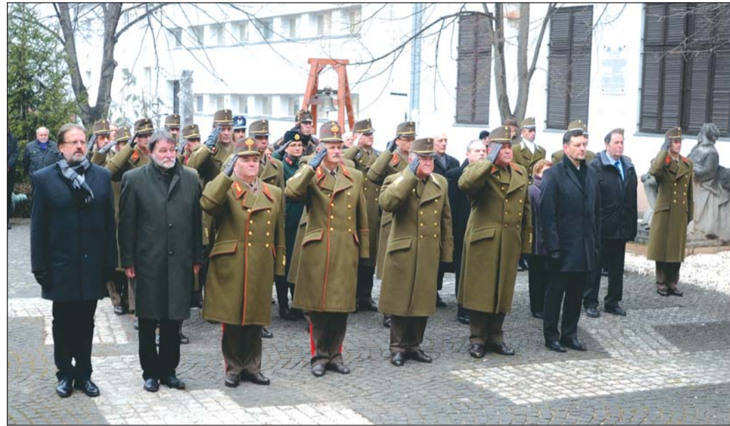
Katonai tiszteletadással emlékeztek a háború áldozataira a Hadtörténelmi Intézet díszudvarán is