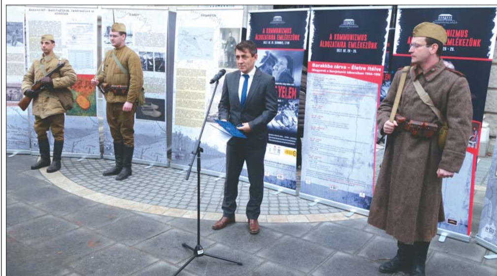
– Sosem szabad elfelejteni, ami a Gulágra hurcoltakkal történt – mondta Potápi Árpád nemzetpolitikáért felelős államtitkár a programsorozat február 20-i megnyitóján

• 2017. február 25-én, szombaton 17.00 órától Matúz Gábor: Nincs kegyelem című filmjének diszeloádása a Magyarság Házában. Az előadást követően beszélgetés az alkotókkal, szereplőkkel és túlélőkkel. Az előadásra a belépés ingyenes.