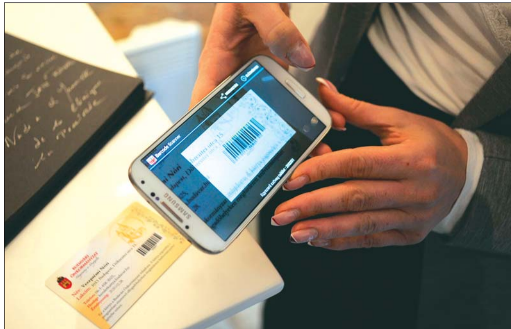
Mobil applikációval is működik az új Kerületkártya