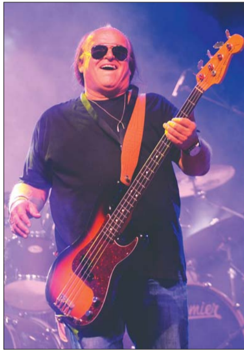
Frenreisz Károly zenész a Nyárbúcsúztató bálón 2015-ben

Kossuth-díjat vehetett át Frenreisz Károly zeneszerző, előadóművész, aki a klasszikus zenei képzettségét a hazai rock-beat korszak több legendás, külföldön is sikeres zenekarának alapító tagjaként kamatoztatta, a magyar könnyűzenei életet népszerű slágerek és film betétdalok sorával gazdagította. Frenreisz Károly több alkalommal is fellépett a május 1-jei Tabán Fesztiválon, 2015-ben pedig a Nyárbúcsúztató bálón a legendás Skorpió együttesrel adtak nagy sikerű koncertet.