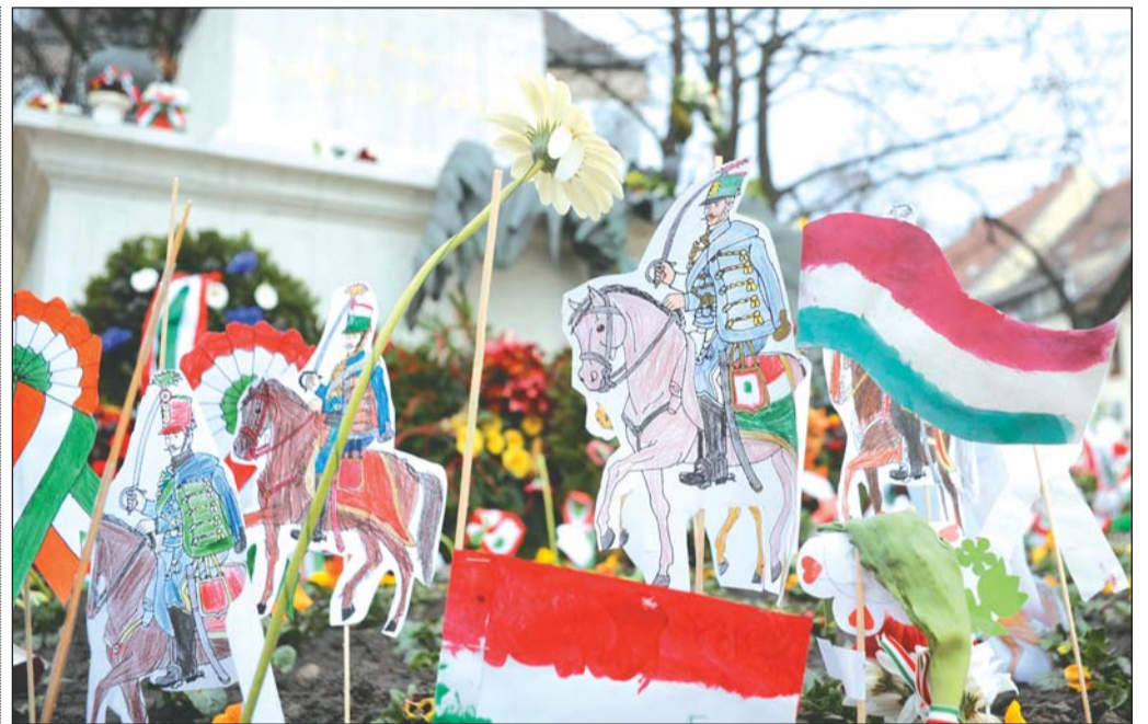
A kerületi óvodások, iskolások saját készítésű rajzokkal öltöztették ünnepi díszbe a Honvéd emlékművet

Éppen ezért nem is meglepő, hogy Nagy Gábor Tamás polgármester ünnepi köszöntőjében azokról a költőkről is megemlékezett, akik a forradalom idején lelkesítették a tömegeket, majd az elnyomás éveiben a hamu alatt őrizték a szabadságharc paraszát és a magyar nyelvet. Fellelevenítette a két ellentétes személyiségi, gyökeresen más habitusú költő, Arany és Petőfi halhatatlan barátságát. „ Forradalom előtti ” az egyik, „ forradalom utáni ” a másik – idézte Németh G. Béla irodalomtörténész a polgármester. Szerb Antal szavaival élve ugyanezt mondhatjuk el a költészetükről is: Petőfi lelki tája a „ rónák végteleje ”, Aranyé a megtört fájdalom országa , amivé