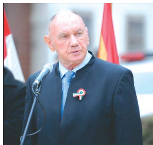
Koncz Gábor szavalta a Nemzeti dalt