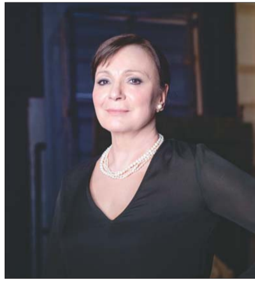
Igó Éva színművész

A magyar művészet értékeinek gyarapítása érdekében végzett magas szintű, igényes teljesítménye elismeréseként Magyarország Kiváló Művésze díjban részesült a szintén a kerületben élő Igó Éva Jászai Mari-díjas színművész, Erdemes Művész.