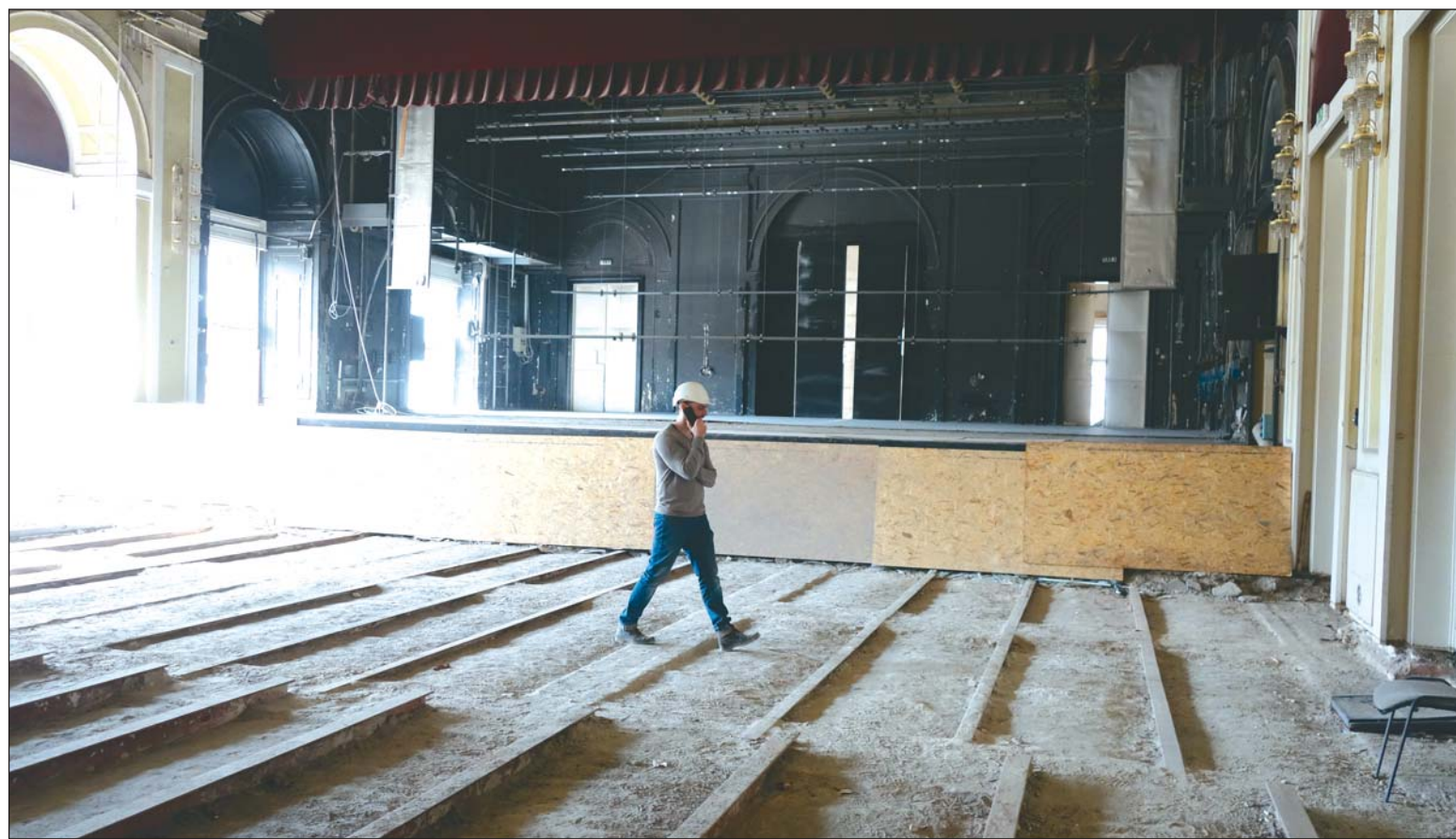
Az egykori nézőtér