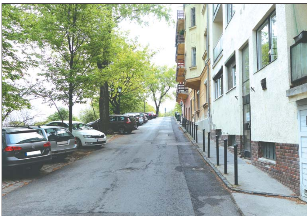
Forgalomkorlátozások várhatók a területen

Lapunk megjelenésével egyidőben, az önkormányzat beruházásában megkezdődik a Naphegy utca út- és járda-felújítása. A munkálatok várhatóan június közepéig tartanak.