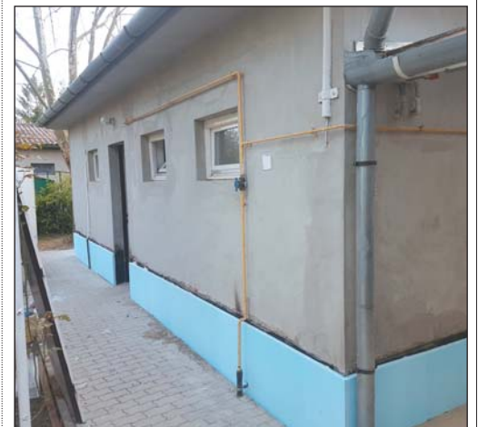
Felújítás alatt a vizesblokk Zamárdiban

– A tervezés utolsó fázisában járunk, a munkát az érettségi vizsgák befejezése utáni időszakra, a nyári vakációra időzítjük. Ez lesz a tetőcseré követő üteme: a munka 2009-ben kezdődött, a középső területen, 2011-ben épült vissza az ikonikus huszártorony, majd 2015-ben a déli szárny tetőzete újult meg. Most pedig az északi szárny kerül sorra, amelyre az önkormányzat több tíz millió forintot biztosít. Jelentős összegeket fordítunk az önkormányzati intézmények, bölcsődék, óvodák, a sportpálya és a gondozási központ karbantartására is. Már javában zajlanak a nyáron megszokott intézményi felújítások előkészületei.