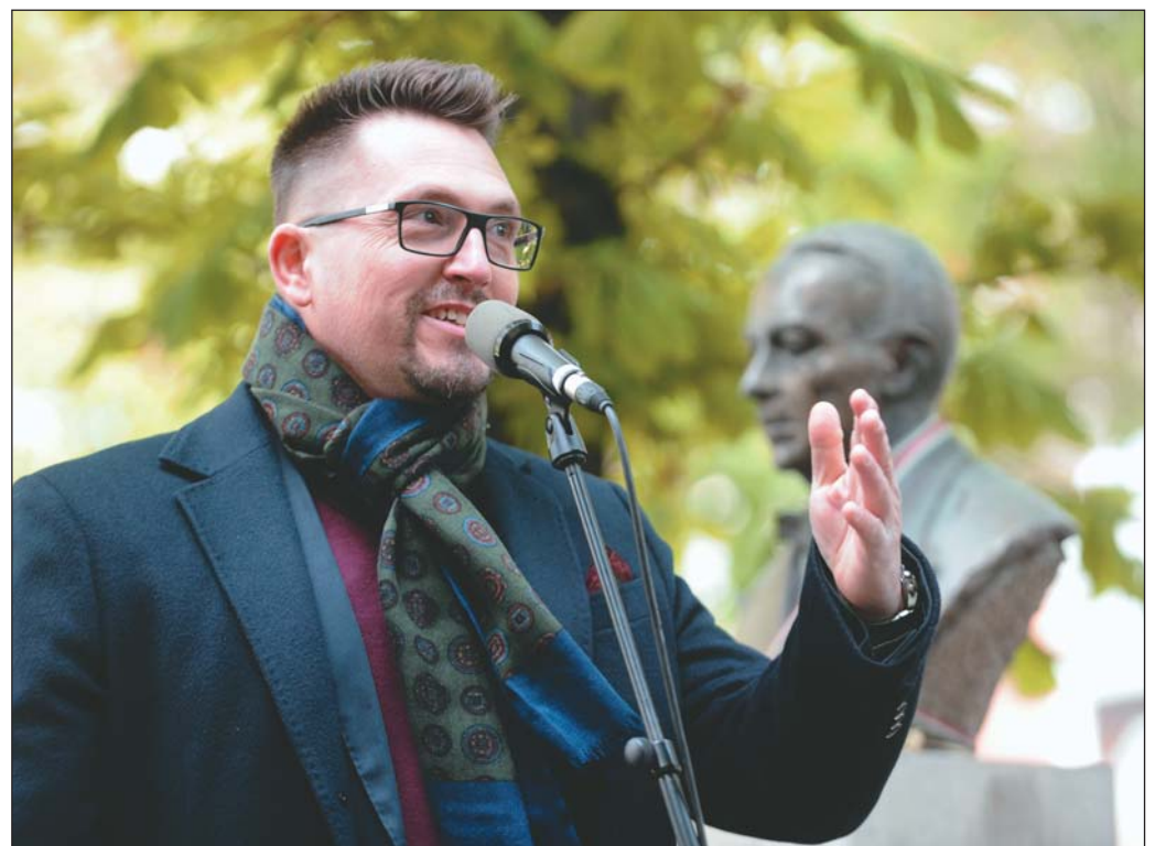
Kovács Ákos Kossuth-díjas előadó nemcsak beszélt a versekről, hanem szavalt is a közönségnek

Ehhez a gondolathoz kapcsolódott Kovács Ákos Kossuth-díjas énekes, zeneszerző, dalszerző is, akit bensőséges viszony fűz a költészethez. Mint mondta, nem lenne énekes, ha nem ismerné a magyar költőket; József Attila nélkül nem írta volna meg az Óda című számot, Ady Endre nélkül nem lenne az Érintő című dalban az a sor, hogy „Minden egész eltörött”. De sokat kapott Csokonai, Radnóti vagy Faludy György verseitől is.