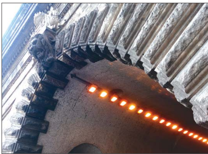
Az Alagút is megújul

A felújítási munka érinti a Clark Ádám teret is, ahol a körforgalom mérete csökken, a gyalogosok viszont bővülnek és új diszburkolatot kapnak. A Lánchíd hídfője felőli oldalon új gyalogos átkelőhelyet létesítenek, ezzel a tér