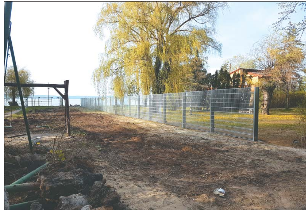
Új területtel gyarapodott az önkormányzat nyaralója – nyáron már használhatják az üdülők

◆ Folytatódik a műemlékház-felújítási program? Idén milyen épületeken végeznek jelentősebb karbantartást vagy felújítást?