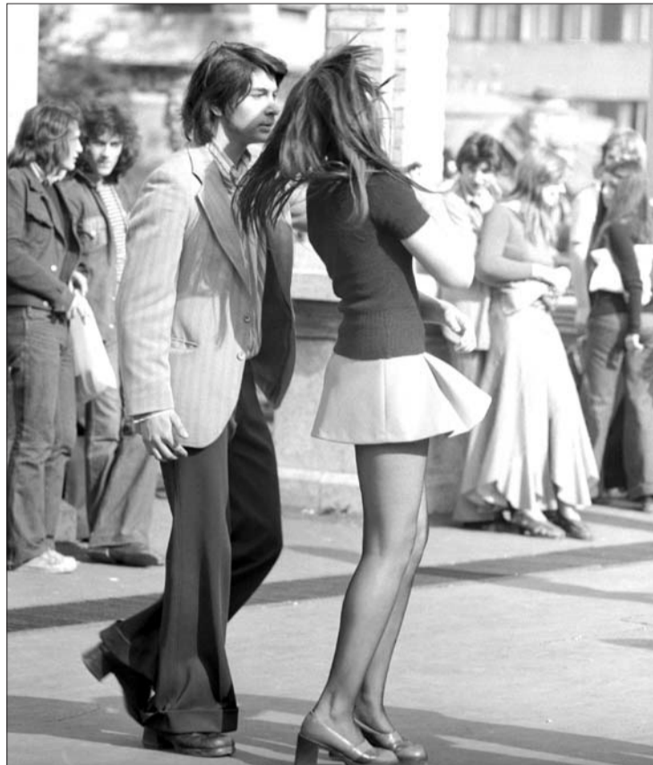
Az egykori Ifipark hangulata

Ha kedd, akkor Mini és P. Mobil. Ez volt a rendszeres program. Minden hét második napján otthon azt mondtuk, hogy moziba megyünk. Helyette irány az Ifipark. Miért lódtotunk? Mert a hetvenes évek végén túl fiatalok voltunk a koncertre járáshoz. Szerencsére a park este tiszor szigorúan bezárt, így komoly kéréssele, de hazaért az ember (mobil nem lévén) aggódó családja körébe.