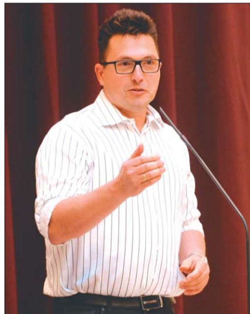
Ákos volt az est meglepetés-vendége

– Imre Géza párbajtőrívó, olimpiikon tehetségével, szorgalmával, emberi helytállásával és sikereivel dicsőséget szerzett a magyarságnak, példát adva ezzel a fiatalabb nemzedéknek kitartásról, szerénységről, sportszerűségről – olvasta fel a polgármester a díszoklevél szövegét. – Budavár új díszpolgárát valóban a kardja teszi azá, ami, mégpedig úgy, abban az értelemben, ahogyan azt Wesselényi gondolhatta. A hűség, az igazságérzet, a megbízhatóság, a józanság és az állhatatosság – ez áll a kivételes sportteljesítmény mögött is, amelyért mi, magyarok és budaváriak köszönettel tartozunk – méltatta a kitüntetettet. Elmondta, külön öröm számára, hogy Egerszegi Krisztina és Puskás Öcsi után ismét egy sportoló vált a kerület díszpolgárává, hiszen a sport olyan erényekre nevel, mint a tisztességes versenyszellem, az önfeláldozás és a közös siker érdekében végzett csapatmunka.