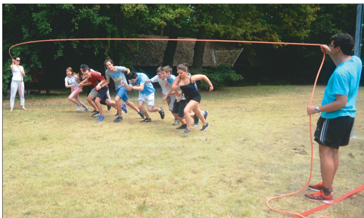
A Horányi Ifjúsági Tábor első vendégei a kerületi kamaszgyerekek