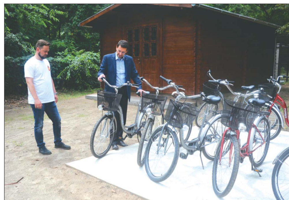
Minden adott a vakációhoz Horányban