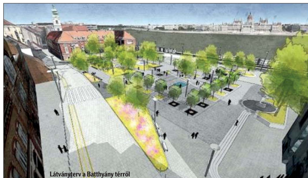
Látványterv a Batthyány térről