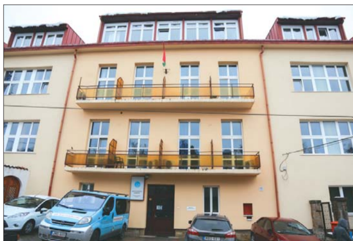
Az otthonápolási tanfolyam helyszíne a Szent Ferenc kórház