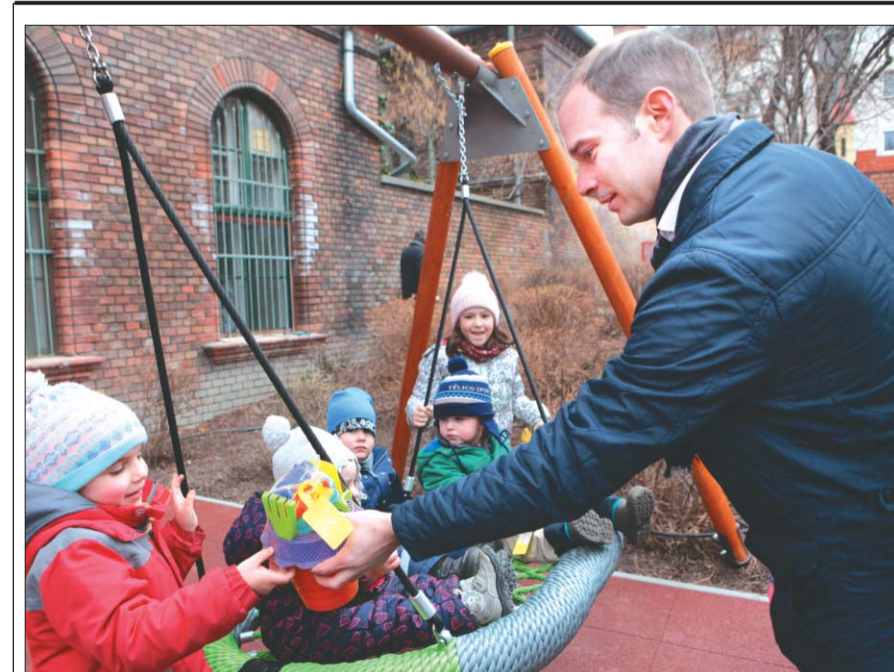
Újabb családbarát fejlesztés kerületben