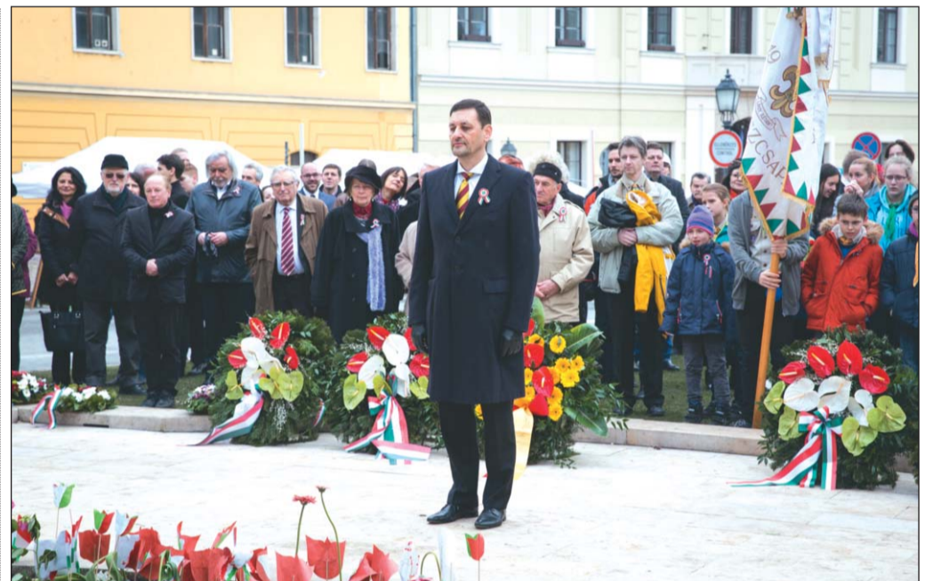
Méltóságteljes megemlékezés a Dísz téren

Mint mondta, 1848-ban a fehér színű, piros és zöld farkasfogakkal szegélyezett zászló a magántulajdonon, a törvény előtti egyenlőségen alapuló és az országgyűlésben képvisellel rendelkező magyar állampolgárok, az egész magyar nemzet