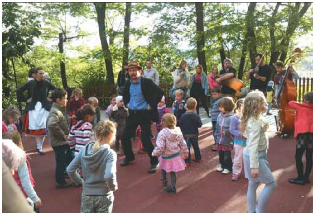
Hagyományörző Mihály-napi ünnepség