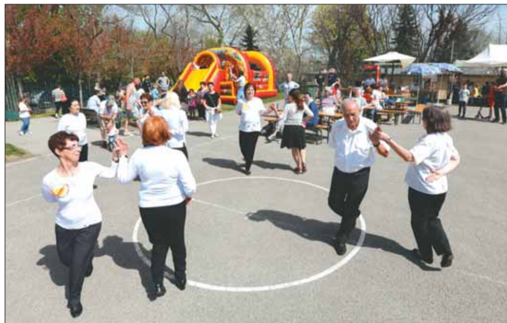
„Nemcsak a húszéveseké a világ” – bemutattak a senior táncosok

A sportnapot Varga Antal alpolgármester nyitotta meg, aki úgy fogalmazott, hogy igazi feltöltődést jelent, ha napsütésben, a jó levegőn és jó közösségben töltjük a napot. Ehhez pedig a Czákó utcai Sport- és Szabadidőközpontban minden adott. Az alpolgármester reményét fejezte ki, hogy nem csupán a sportnapon, de a hétköznapokon is minél többen kilátogatnak a Czákóra, hogy a családdal, a barátokkal közösen mozogjanak és jól érezzék magukat. – Hiszen erről szól ez a hely! – tette hozzá.