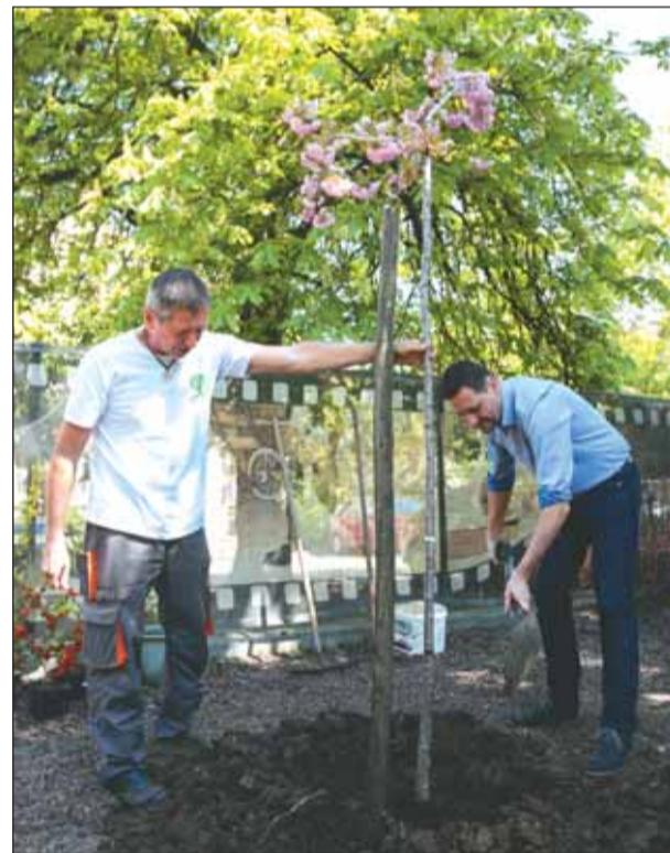
Faültetés a Vuk játszótéren