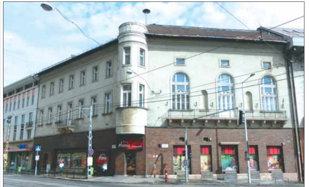
Krisztina tér 1. – az egykori Budai Polgári Casino székhelye. Az épület a kerület tulajdonába kerülhet, a felújítás után a Budavári Művelődési Háznak adhat otthont.

csökkenés figyelhető meg: 2016. évben 339, míg 2017. évben 310 bűncselekményt regisztráltak a kerületben. A vagyon elleni bűncselekményeken belül jelentős, 22,4 százalékos csökkenés figyelhető meg a lopások (a betöréses lopásokkal együtt) számának alakulásában, 2016. évben 562, míg 2017. évben 436 lopást regisztráltak. Nagy mértékben csökkent (93-ról 61-re) a lakásbetörések száma is; a beszámoló kiemeli, volt olyan, majdnem két hónapos időszak a kerületben, amikor nem történt betöréses lopás a kerületünkben. Erőteljes csökkenést mutat a gépjármű feltörések a száma is. A beszámoló külön kitér a kábítószerrel kapcsolatos bűncselekmények helyzetére is: az elmúlt évben mind-