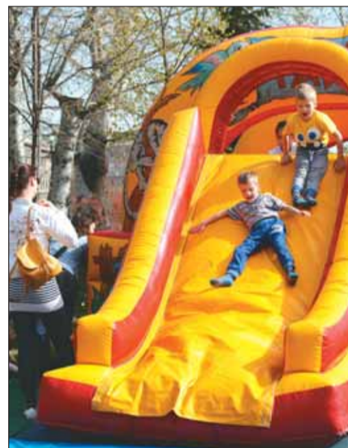
A légvár mindig nagy siker