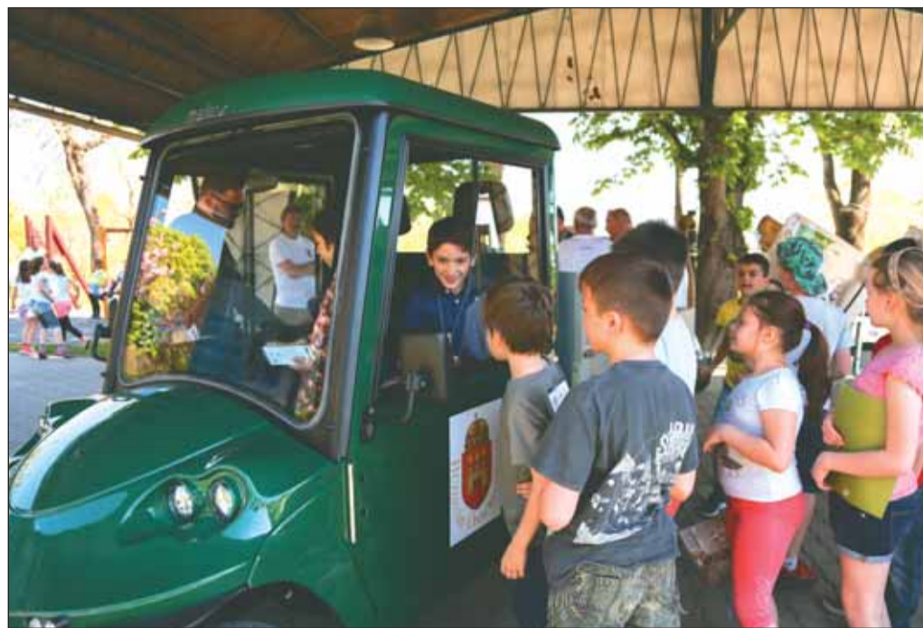
A Gamesz új, elektromos kisteherautóját a gyerekek is kipróbálhatták a Föld Napján

– Ez a szemlélet vezette a Budavári Önkormányzatot is, amikor számos egyedülálló, úttörő kezdeményezést vezetett be – hangsúlyozta. Példaként említette, hogy a Budavári Önkormányzat elsőként biztosított ingyenes parkolást a zöld rendszámú, elektromos meghajtású autók számára, a szabályozást később a főváros is átvette. Az elektromobilitást ösztönzi a kerület azzal is, hogy e-töltőket létesített a kerület több pontján.