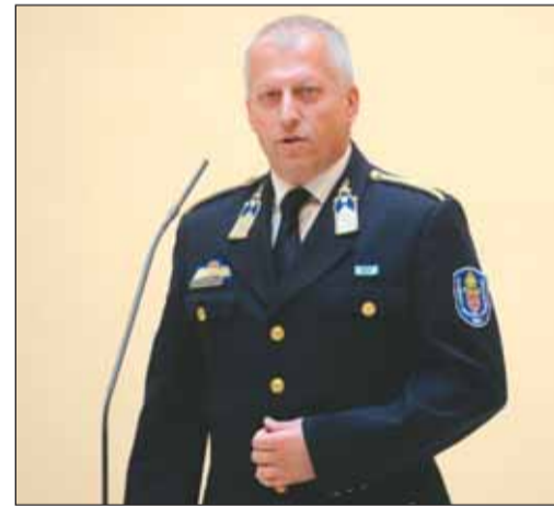
Krammer György rendőrkapitány: Budavár az egyik legbiztonságosabb kerület a fővárosban

A tavalyi évben tovább erősödött a kerület közbiztonsága, Budavár az egyik legbiztonságosabb kerület a fővárosban. A rendészeti és bünygyi eredményesség az elmúlt évek legkiemelkedőbb számaikat mutatják – így összegezte a tavalyi évet a Képviselő-testületnek adott beszámolójában Krammer György, a rendőrkapitányság vezetője. Mindezt jól mutatják a számadatok is. A regisztrált bűncselekmények száma a tavalyi évben közel 20 százalékkal csökkent. A közterületen elkövetett bűncselekmények számában 8,6 százalékos