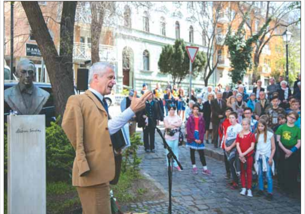
Reisinger János előadása a Márai szobornál

- A magyar nyelv az igazi hungarikum, mert öt versrendszerben tud megszólalni, amíg a többi