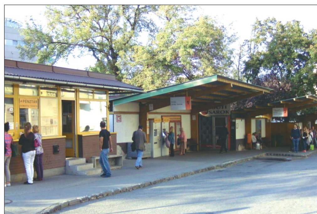
A felújítással megszűnik a buszpályaudvar a Széna téren

A cél az, hogy az autóbussz-végállomás megszüntetésével és a terület átalakításával, felújításával