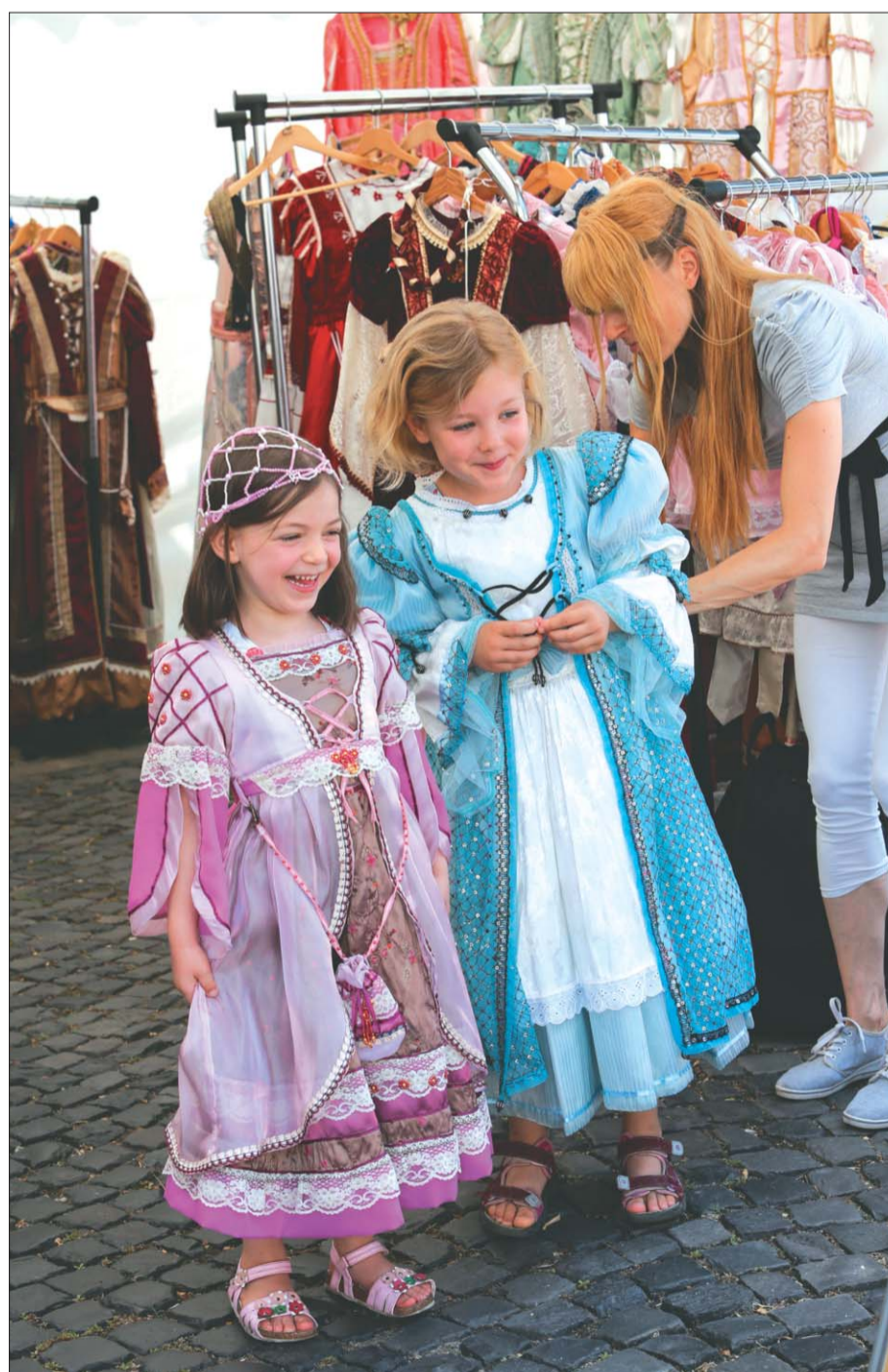
„Igazi” hercegnők a reneszánsz udvarban