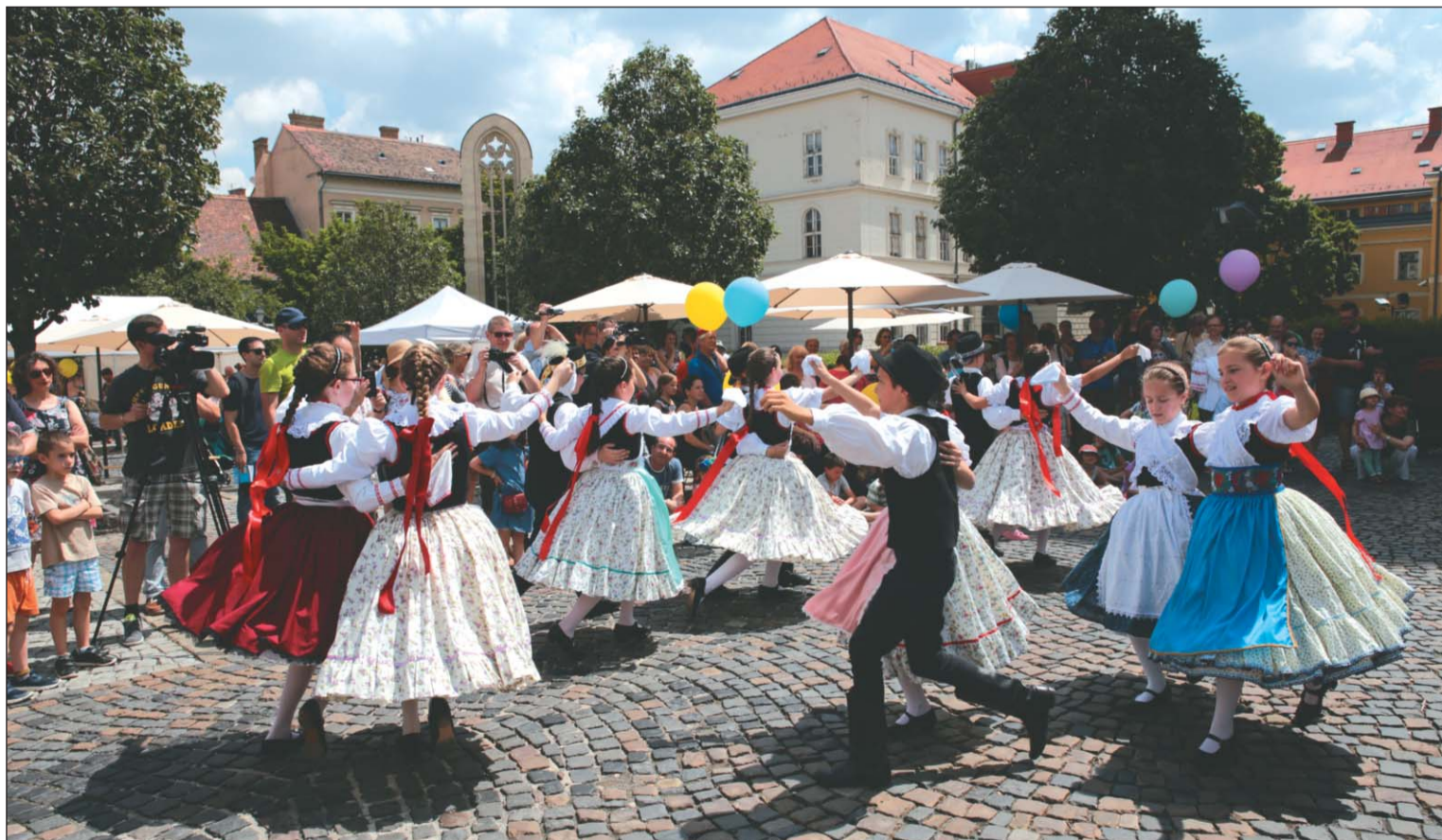
Május utolsó vasárnapján a Budavári Önkormányzat színes programokkal várta a gyerekeket a Kapisztrán térre