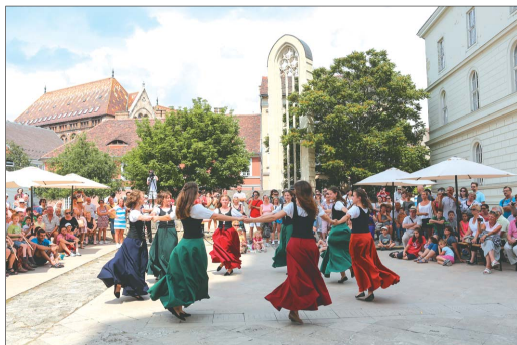
Reneszánsz táncok a Primavera táncegyüttessel