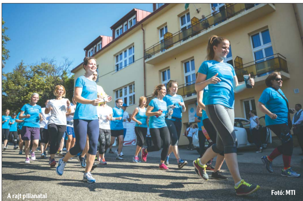
A rajt pillanatai

A rendezvényhez csatlakozott a Budavári Önkormányzat is, a Polgármesteri Hivatal munkatársai véradással segítettek az akciót (képtünkön).