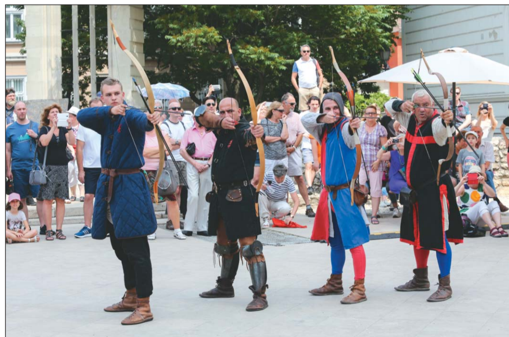
A Szent György Lovagrend haditorna bemutatója