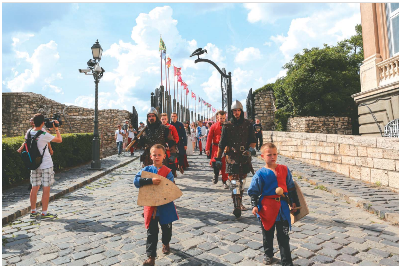
A Hunyadi udvarban Hunyadi László haláláról is megemlékeztek

A polgármester végül e szavakkal indította el a sétát: – Ismerjük a történelem további menetét, tudjuk, hogy amikor erős, egységes volt az ország, milyen csodákra volt képes. Azt is tudjuk, hogy amikor a széthúzás, a kívülről szított viszályok gyengítették, akkor idegen megszálló seregek és hatalmak prédájává tették. A virágzó Budai Várból egy kifosztott és felégett várat kaptunk vissza jó 150 évvel később. A Budai Vár azonban egy csodálatos allegória. Emlegetjük, hogy ahogy Budán mennek a dolgok, úgy történnek az országban is. Ez a Vár, amely annyi kataklizmát élt meg, mindannyiszor újjá tudott épülni. Mindannyiszor újra tudtuk kezdeni, újra és újra hitet, erőt és reménységet nyertünk őseink hitéből,