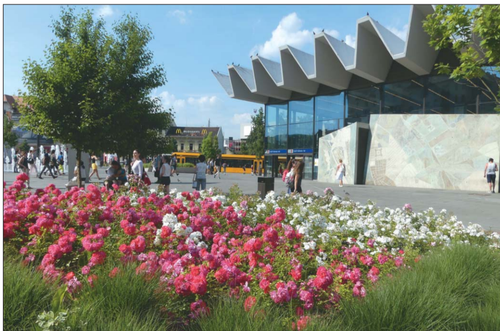
A Széll Kálmán tér már 2015-2016-ban megszépült a főváros beruházásában

és a Hattyú utca kapcsolódó szakaszait is. A felújítás következtében a csökkenne a zaj- és a levegő-szennyezettsége, továbbá a lehetséges közterületi fejlesztéssel a környezet minősége, építészeti értéke és használhatósága is jelentősen javulna. A felújítás összköltsége mintegy 2,5 milliárd forint. D.