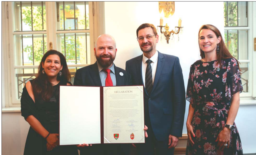
A Carouge-i és a Budavári Önkormányzat vezetése megerősítette a testvérvárosi együttműködést

– Carouge és Buda együttműködése, barátságának ereje nem kizárólag a személyes kapcsolatokból, hanem a közös európai gyökerekből is fakad – mondta a polgármester. Úgy fogalmazott, hogy az európai múlt – időtől és tértől