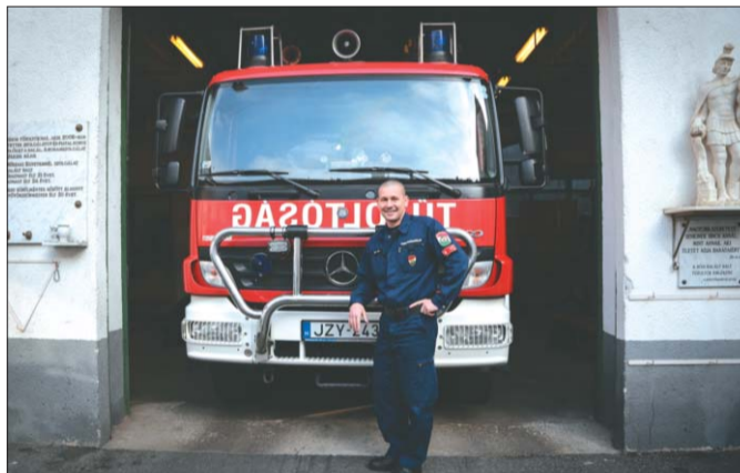
A kerület biztonságáért a katasztrófavédelem munkatársai is sokat tesznek