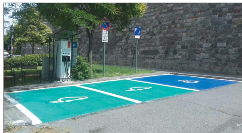
A Budavári Kapu Kft. beruházásában speciális burkolatot építettek a Lovas úti elektromos töltőállomáshoz

Sor került az idei költségvetés módosítására is, hogy az időközben felmerült változásokat átvezzék. Többek között plusz forrást biztosítottak a sajátos nevelési igényű gyermekek óvodai ellátására, a Szentháromság téri pavilonos tervezésére és felújítására, valamint a Budavári Játszóteret Üzemeltető Nonprofit Kft. finanszírozására. Ez utóbbira azért volt szükség, mert az állagfelmérés során kiderült, a téli időszakban több eszköz is megrongálódott és rendkívüli karbantartást igényel.