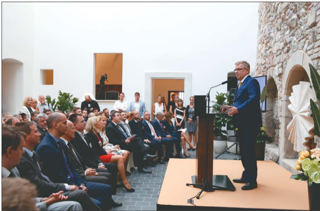
Matolcsy György, az MNB elnöke nyitotta meg az új intézményt

A XVIII. századi bővítéskor emelt következő szint egybenyitott teremsora nem lesz látogatható, itt előadótermek és tárgyalók szolgálják az alapítvány munkatársait és a hallgatókat. Eredeti barokk kori fenyegetőrendák zegzugát házították a kortárs építészeti elemekkel a tetőtérben, ahol iroda és előadó terek segítik a munkát. Az elmúlt két esztendő színvonalas szakmai munkájának hála, a Bölcs Vár a budai polgárváros egyik legteljesebben feltárt és dokumentált műemléke.