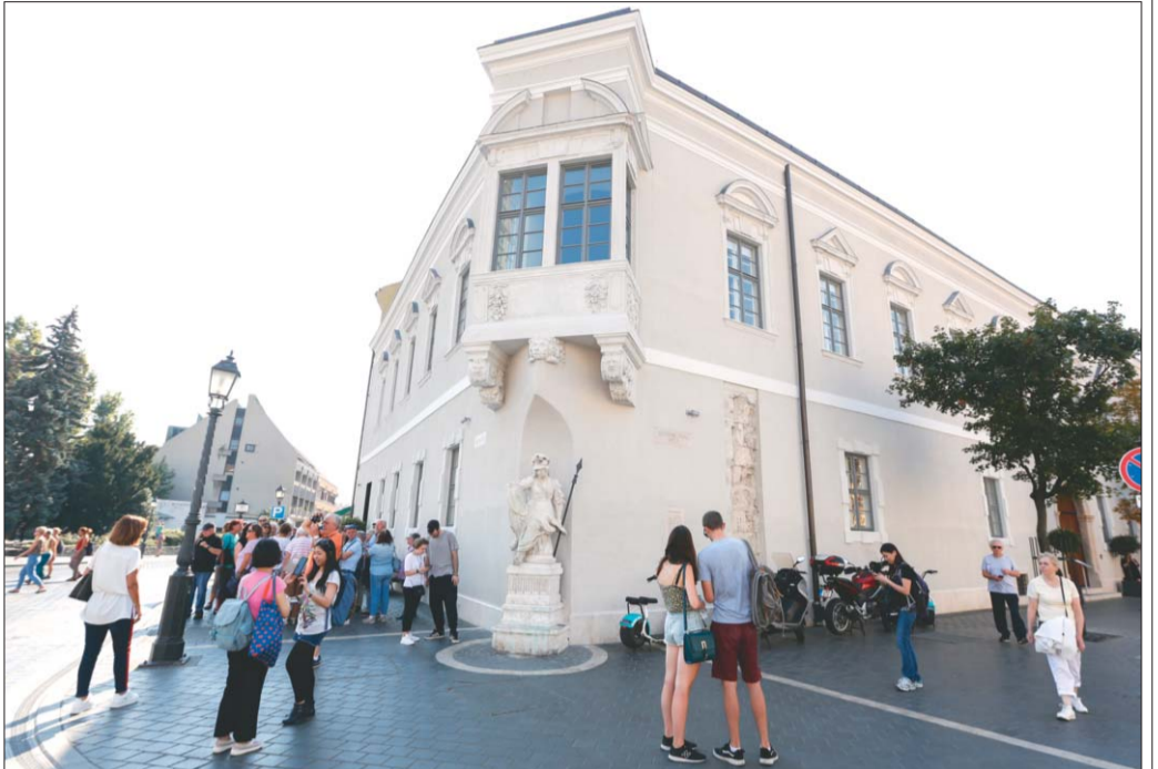
Bölcs Vár - Tudás Háza a Szentháromság téren