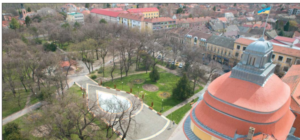
Zenta látképe az Emlékkilátóból

– Hálás vagyok azért, hogy évtizedeken át ismerhettem Sándor bácsit. Bátor, önmagát soha meg nem tagadó, következetes ember volt. Nem ismerte a megalkuvást és sajátos módon ez szabaddá tette a diktatúrában is. Egénysége és erkölcsi tartása tiszteletet ébresztett még az állampártban is. Verseivel, amelyen generációk nőttek fel, már életében a kortárs magyar irodalom egyik kiemelkedő alakjává vált. A tárlatvezetésen lehetőség nyílik arra, hogy még jobban megismerjük: hogy mit jelentett neki Nagygalambfalva, a kolozsvári otthon, az íróasztala, az írógépe, amit szinte mindenhol magával vitt. Így mindenki egy kicsit újra találkozhat Sándor bácsival. B.L.