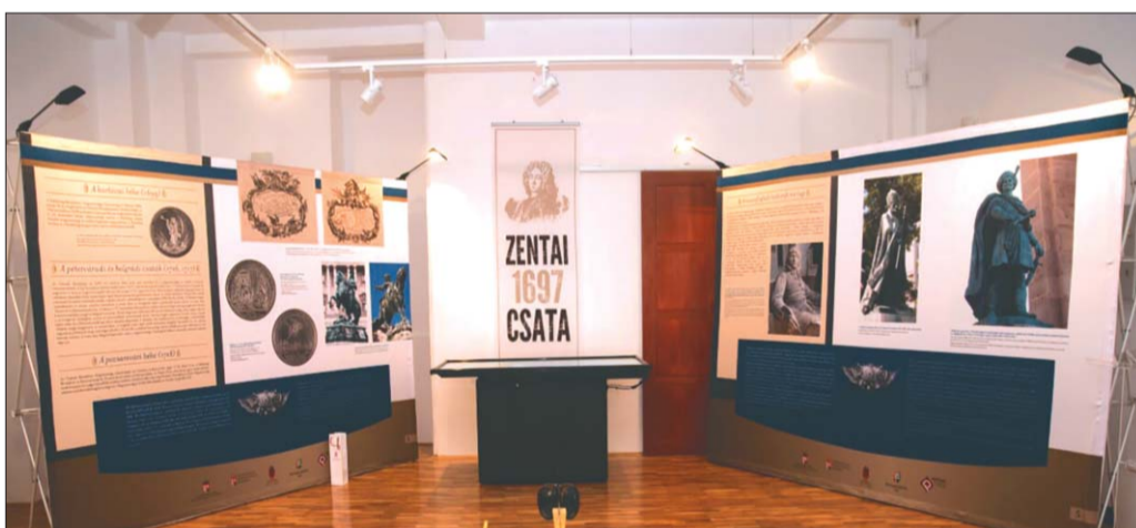
Részlet a kiállításból

– Nagy hangsúlyt fektetünk arra, hogy a határon túl élő fiatalok is megismerhessék az anyaországot, azokat a történelmi helyszíneket, amelyek erősítik az összetartozás érzését. Ezért rendszeresen szervezünk nyári táborokat és közös kirándulásokat. Komoly uniós programokban is gondolkodunk, megosztjuk tapasztalatainkat, legutóbb például a szolidaritás jegyében rendezett zentai konferencián mutattuk be az itt bevált gyakorlatainkat, programjainkat. Régóta déledgetett álmunk, hogy Savoyai Jenő lovas szobrának másolatát – az eredeti Zenta megrendelésére készült, de a Budai Várban áll – a zentai főtéren is felállítsuk. Sajnos, ehhez a két önkormányzat anyagi lehetőségei nem elegendőket. Bizom