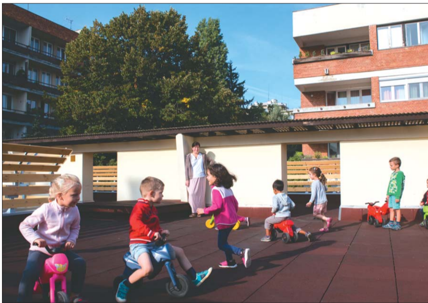
Megújult óvoda és új játékok: az önkormányzat vezetése kismotorokat is vásárolt a gyerekeknek

rosi családok számára biztos bázist jelent. Szólt arról is, hogy tavaly Zöld Óvoda pályázatot nyertek, így a környezet- és természetvédelem kifejezetten fontos számukra. Éppen ezért fogadták örömmel, hogy energetikai felújítással is támogatja ezt a munkát az önkormányzat. – A fenntartó jó gazda módjára gondoskodik az intézményeiről, minden évben, lépésről lépésre történnek felújítások, amely egyszerre szolgálja a gyerekek és az itt dolgozók kényelmét, biztonságát – emelte ki az óvodavezető. A tervek szerint a következő években korszerűsítik a fűtési rendszert és a lapostetőre árnyékoló-szerkezet kerül majd.