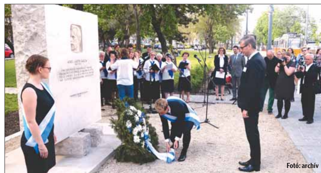
A Finn Nagykövetség már többször is szervezett megemlékezést Akseli Gallen-Kallela emlékművénél a Duna-parton