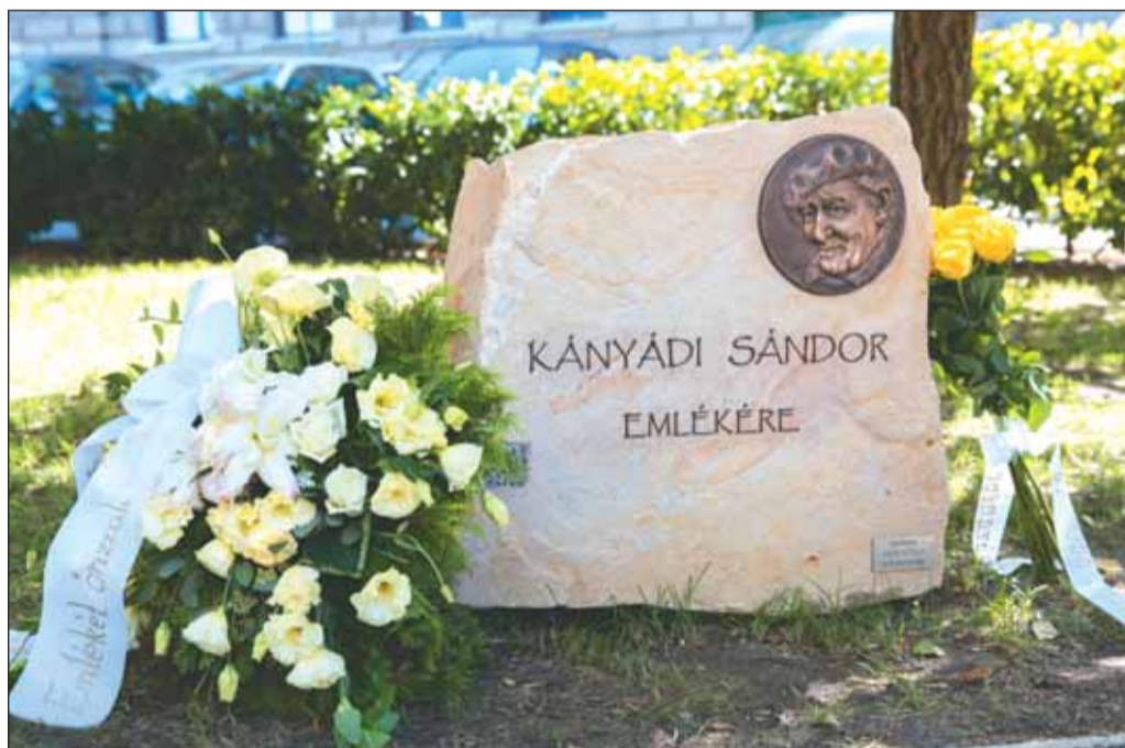
A sziklán található QR-kód leolvasásával még többet tudhatnak meg a látogatók a Kossuth-díjas költőről

– Amikor Kányádi Sándor a nyáron itt hagyott bennünket, úgy éreztük, hogy szeretnénk megőrizni az emléket, szeretnénk adni valamit köszönetként mindazért, amit mi kaptunk tőle. Megköszönni egy-egy útravalóként adott gondolatot, tanítást, verset, a Mesemúzeum vagy a Budavári Tóth Arpád Műfordító díj ötletét. Egyértelmű volt számunkra, hogy tiszteletünk jeléül ebben a parkban helyezzük el emlékkövét, rajta a portréját, hogy mindig emlékezzünk rá, és mindarra, amivel szolgálta szűkebb és tágabb hazáját – mondta a polgármester.