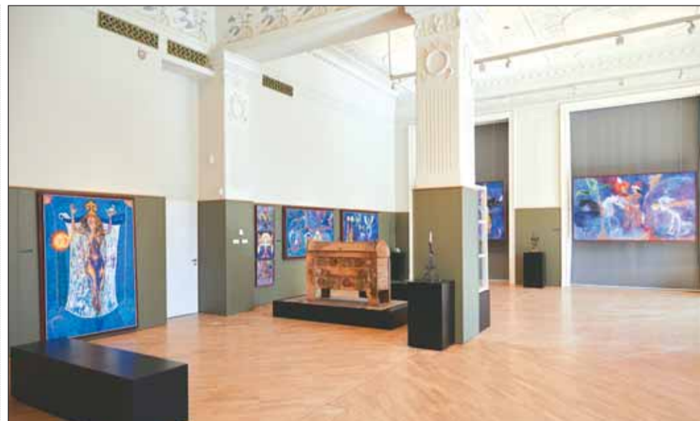
Megújult terek a Budai Vigadóban

– Néha azt hallom, hogy Magyarországon kultúrharc zajlik. Azt gyanítom, hogy az egyes pozíciók körüli lökdösődés, a kultúrfilozófiák közötti hírlapi vita talán a modern élet megszokott rendjéhez tartozik – mondta köszöntőjében a kormányfő. Szerinte azonban Magyarországon inkább kultúrbeke van: lassan teljes egyetértés formálódik arról, hogy „a jövőnk családra, a munkára és a nemzet újraegyesítésére kell építeni”. Hangsúlyozta: az európaiak tiszteletben tartják a más kultúrákat és képviselőiket, de „senki sem