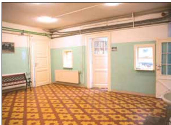
Az alagsort alakítják át a betegek kényelméért

A Maros utcai szakrendelő felújítását és bővítését a kormány 173 millió forinttal támogatja a programból.