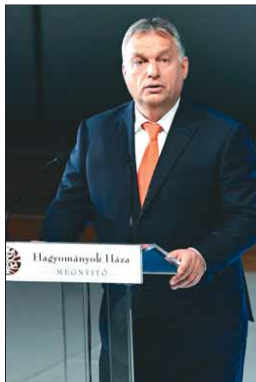
Orbán Viktor miniszterelnök a megnyitón.

Október elején négy napos ünneppé, táncelőadásokkal, táncszínházakkal, koncerttel, gyerekprogramokkal, kézműves workshopokkal, kiállításokkal költözött vissza a Hagyományok Háza a Budai Vigadó felújított tereibe. Az intézményt október 4-én Orbán Viktor miniszterelnök adta át.