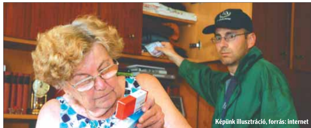
Képünk illusztráció

Ha bárki azzal csönget be Önhöz, hogy pénz hozott, amely visszajár valamilyen szolgáltatótól, azonnal fogjon gyanút! Sem a szolgáltatók, sem a hivatalok munkatársai nem kézbesítenek túlfizetésből adódó készpénzt! Ilyen esetekben a többletet a következő esedékes számlákon írják jóvá, illetve postai úton, vagy átutaláson fizetik ki a különbözetet. A hivatalok alkalmazottjai sosem