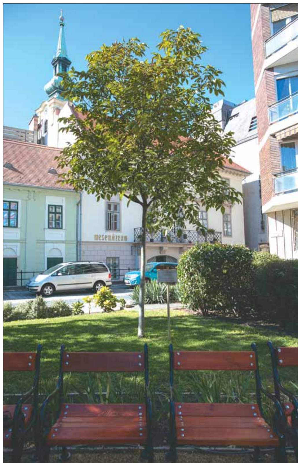
Sándor bácsi díófája, előtte az új padok, rajtuk egy-egy üzenettel, idézettel