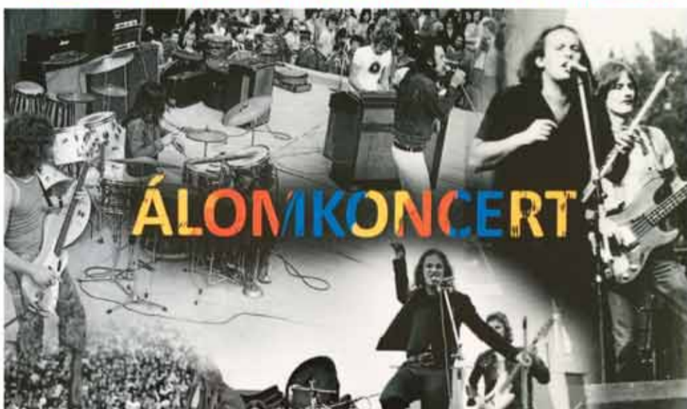
Az illusztráción az új, Álomkoncert elnevezésű CD borítójának egy részletét láthatják.

Nem volt rossz és unalmas életed. Nagy időben zenéltél.