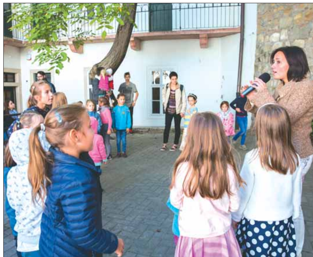
Gyermekkoncert a Virág Benedek Ház udvarán