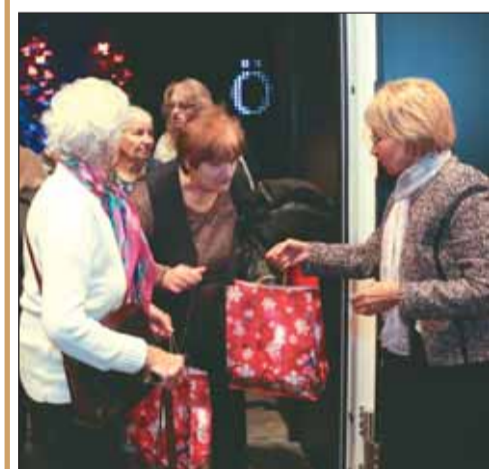
Meglepetés a kerületi időseknek

További információ: a +36-1-356-6584-es telefonszámon (Gondozási Központ).