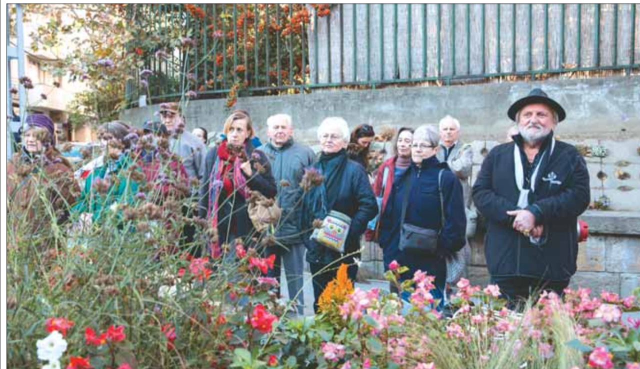
Barátok, pályatársak, egykori szomszédok, a szeretett Krisztinaváros polgárai emlékeztek Gyurkovics Tiborra