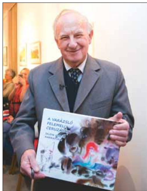
A „Varázsló” az új albummal

A galériába lépve azonnal a Sajdik-univerzumba csöppentünk. Minden kép, minden grafika elvarázsolja a nézelődőt. Akadnak színes mesevárosok, álomszerű utcák, tájak és karakterek. Ezeket a festett színtereken is százezer esemény zajlik, tucatnyi ismeretlen ismerős tűnik fel és egy-egy apró részlet önállóan is elgondolkodtat vagy mosolyra fakaszt. Külön részt alkotnak a képregények, valamint a háromdimenziós portrék, amelyeken a karikatúrát a Mester még megtoldja egy képből kiemelkedő tárggyal is. Balassi Bálintét például a kép üvegét áttörő ágyúgolyóval, Zek Zoltánét két egyforma, feliratozott kis csomaggal. Az egyiket ez olvasható: „11 év börtön”, a másikat pedig ez: „1 Kossuth-díj”. A paraszt figurákról író Tömörkény István képkeretébe bugylibicska került, a „titokzatos” Csokonai Lili előtt pedig Eszterházy Péter ücsörög bábu alakjában. Sajdik Ferenc önportréja több képen is előbukkan, hol kommentál, hol maga is szereplő.