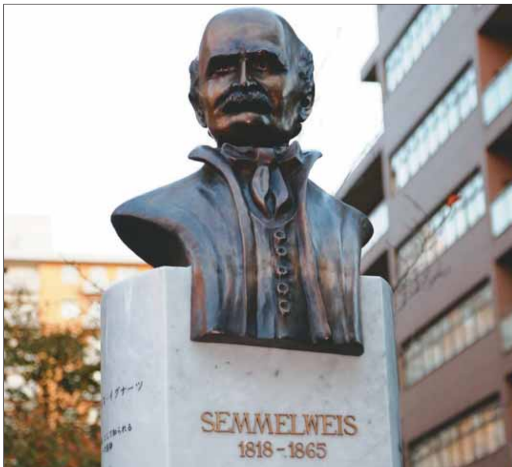
Semmelweis szobra Tokióban