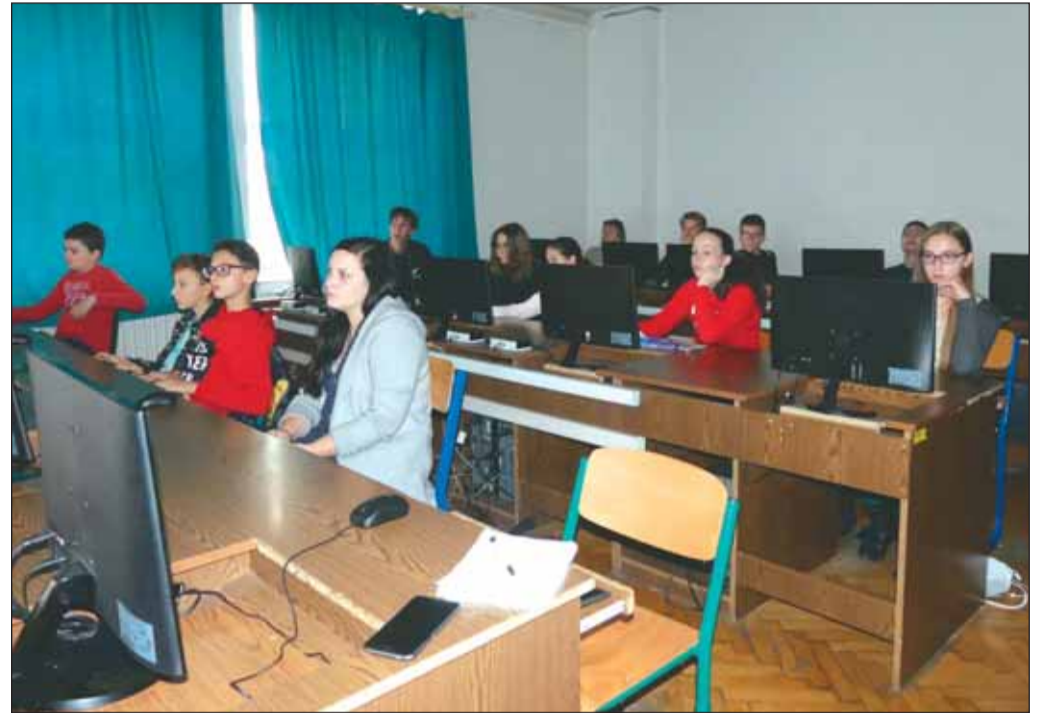
Geomatech óra a Szilágyi Gimnáziumban

A program keretében negyven pedagógus továbbképzése kezdődik meg és 400 tanuló szintje már azonnal részese lehet az eredményeknek, hiszen a pedagógusok a tanultakat akár