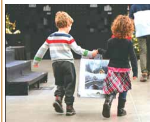
Ajándékok várják a gyerekeket

Érdeklődni a +36-1-356-8363-as telefonszámon lehet.