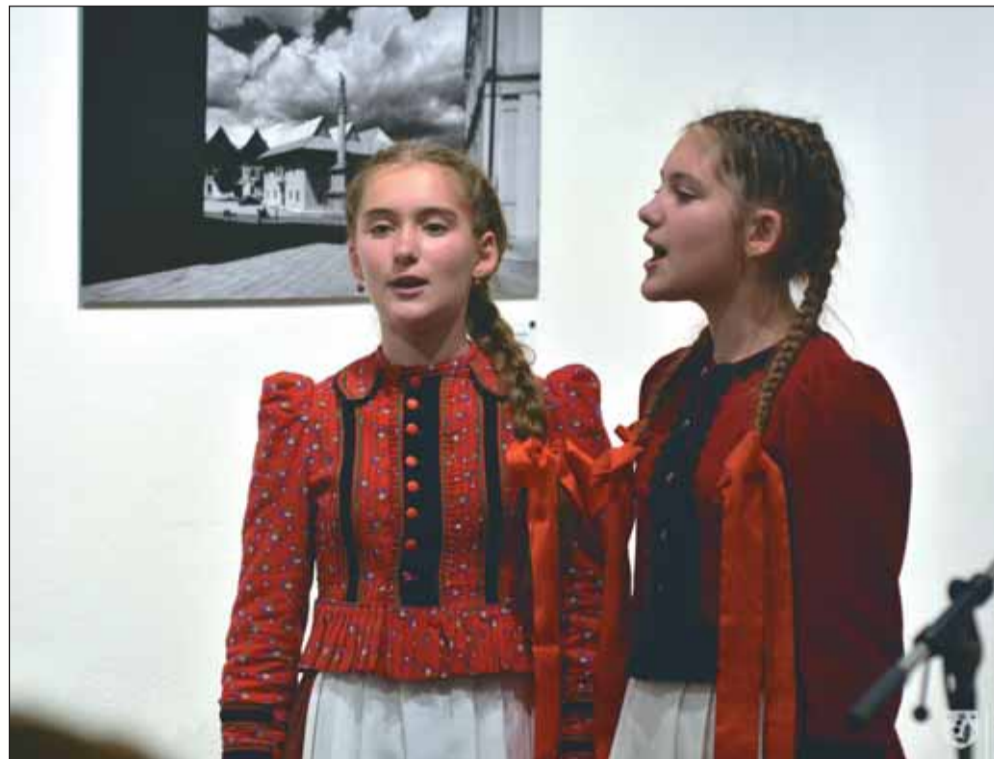
Kiállítás megnyitó Székelyudvarhelyen