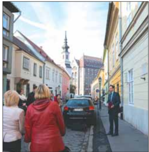
Tóth Árpád egykori lakóháza előtt

90 éve, 1928. november 7-én hunyt el Tóth Árpád, a XX. század legnagyobb magyar elégia-költője, műfordító, aki élete utolsó évtizedében a Táncsics Mihály (akkor Verbőczy) utca 13. szám alatti ház egyik lakásában élt családjával. Nagy Gábor Tamás a Táncsics Mihály utcai Tóth Árpád emléktáblánál erre is felhívta a résztvevők figyelmét.