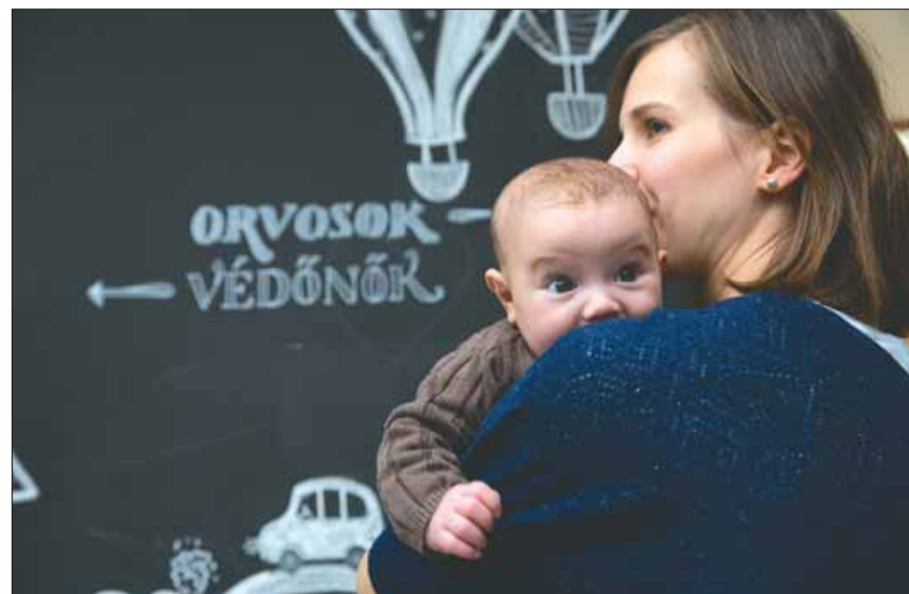
Védőnői tanácsadásra érkezett a megújult rendelő első „látogatója”