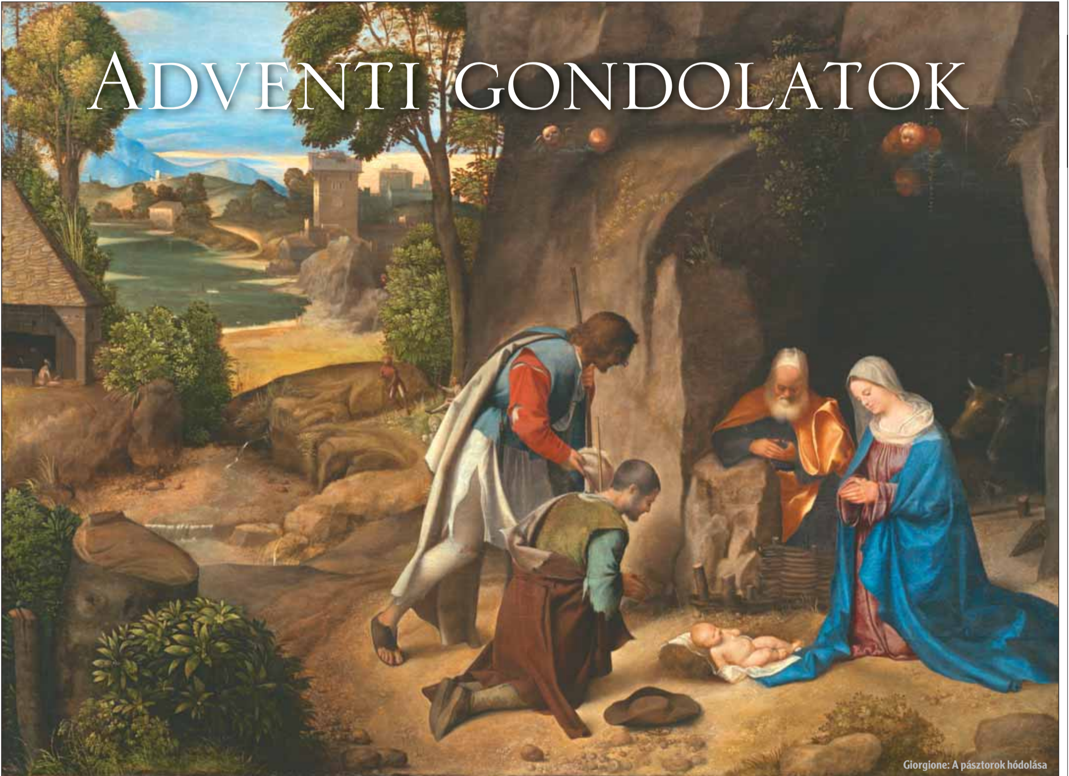
Giorgione: A pásztorok hódolása