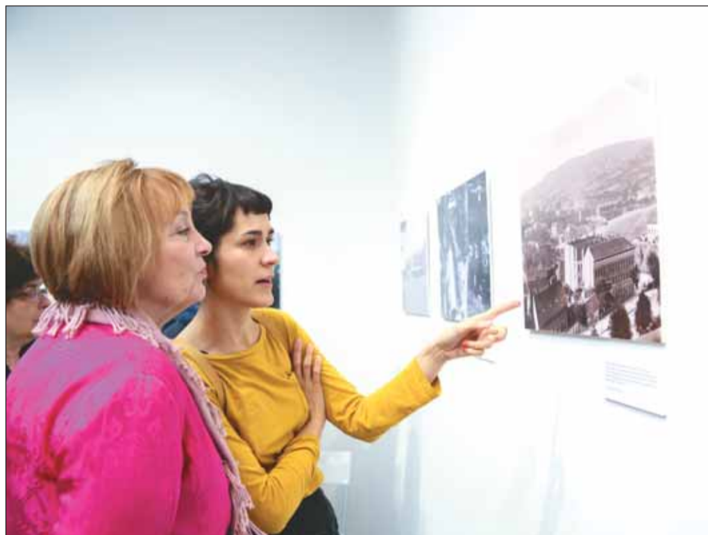
A felnagyított fekete-fehér képek és a kísérőszövegek segítségével feltárul a legendás „Krisztina”

A tárlat megnyitóján Viczián Zsófia művelődéstörténész arra hívta fel a figyelmet, hogy a képek javarészt nem azért készültek, hogy doku-