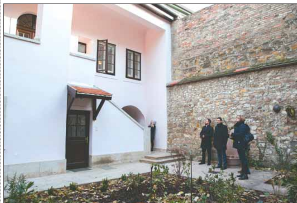
Nemcsak a homlokzatok, hanem belső épületek, udvarok, lépcsőházak is újjaszülettek