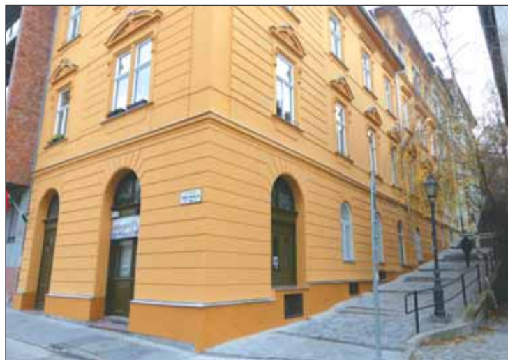
A társasház-felújítási pályázaton nyert forrás segítségével újíttotta fel a lakóközösség a Toldy utcai épületet. Jövőre még több forrás áll rendelkezésre.

A társasházak felújításának támogatására 2019-ben 100 millió forintot biztosít az önkormányzat. 2017-ben 54, 2018-ban 80 millió forintos támogatást ítélt oda a testület, de a nagyszámú pályázatra tekintettel tovább emelik a keretet. Megkezdődik a Krisztina tér 1. szám alatti épület felújítása, itt kap majd helyet a Budavári Művelődési