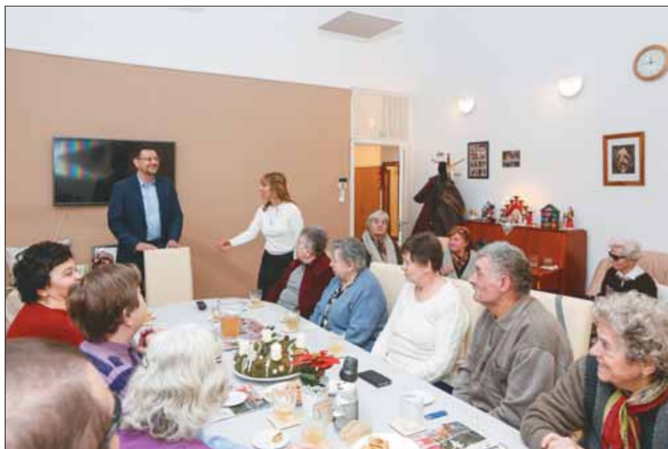
Adventi együttlét az Idősek Klubjában

Az ünnepek közeledtével még nagyobb figyelmet szentel a kerület vezetőse az időseknek. A kerületben élő 80 év feletti polgárok, a rászoruló nyugdíjasok számára 8000 forint értékben Erzsébet-utalványt biztosítanak, amelyet decemberben postán küldött meg az önkormányzat. Az Idősek Klubjainak tagjai pedig Nagy Gábor Tamás polgármestertől vehették át a karácsonyi támogatást (képek lent). Emellett az idősek, egyedül élők számára az önkormányzat az idei évben is megrendezi a karácsonyi zenés együttlétet a Várkert Bazárban.