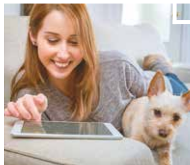
Elektronikusan is nyilatkozhatunk

elektronikusan is leadhatók az ügyfélkapun keresztül vagy az online bejelentő felületen. Az online bejelentő felület megtalálható a www.budavar.hu oldalon az Ügyintézés, Szolgáltatások, Tájékoztatók menüpontban belül az Ügyintézés, Igazgatás almenün keresztül a „Tovább az Ebösszeírás 2019 online bejelentő felületre” linken.