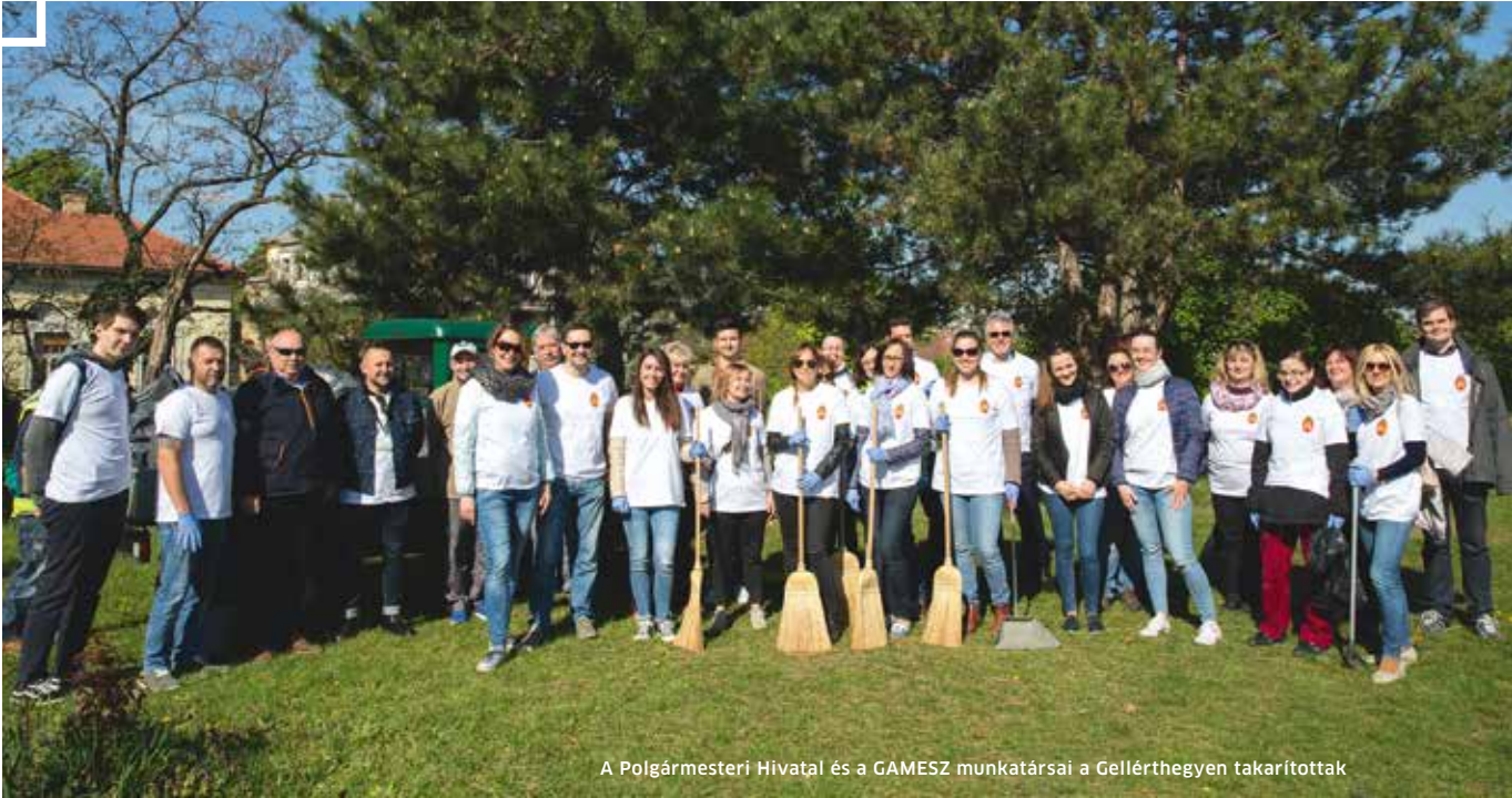
A Polgármesteri Hivatal és a GAMESZ munkatársai a Gellérthegyen takarítottak

Április 22. a Föld Napja. A Budavári Önkormányzat közös kerület-takarítással és faültetéssel hívta fel a figyelmet a környezetvédelem fontosságára.