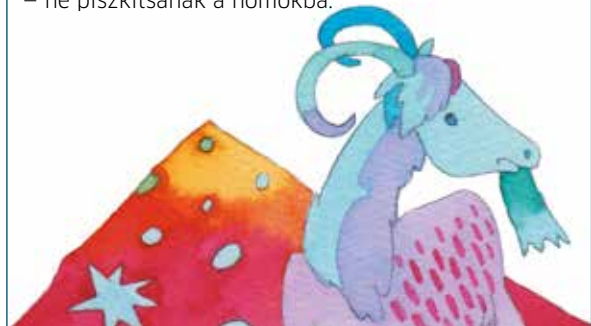
Damó István illusztrációja