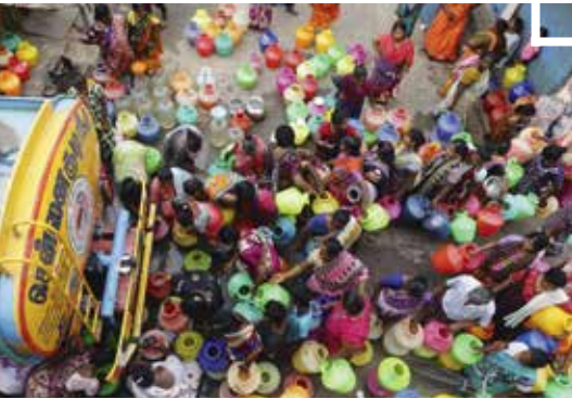
Klímváltozás: Indiában már milliókat érint a vízhiány

Az egyik leghétköznapibb mozdulat, amikor kinyitjuk a vízcsapot, ha inni, főzni, fürdeni szeretnénk. Csak akkor zökkenünk ki a rutinból, ha a csapból víz híján hörgő hang érkezik. Ám ekkor sem gondolunk bele, hogy a bolygó túlsó felén számos helyütt még csap sincs, nemhogy vezetékes ivóvíz.