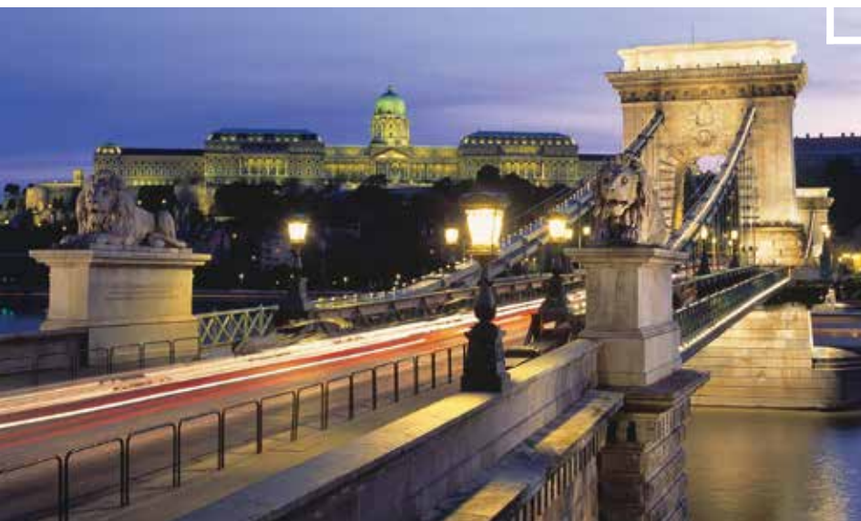
Megújul a híd díszkivilágítása is

A munka október-novemberben indulhat, két és fél évig tarthat, a hidat és az Alagutat másfél évig lezárják a közúti forgalom elől. A beruházás mintegy 23 milliárd forintba kerül majd.