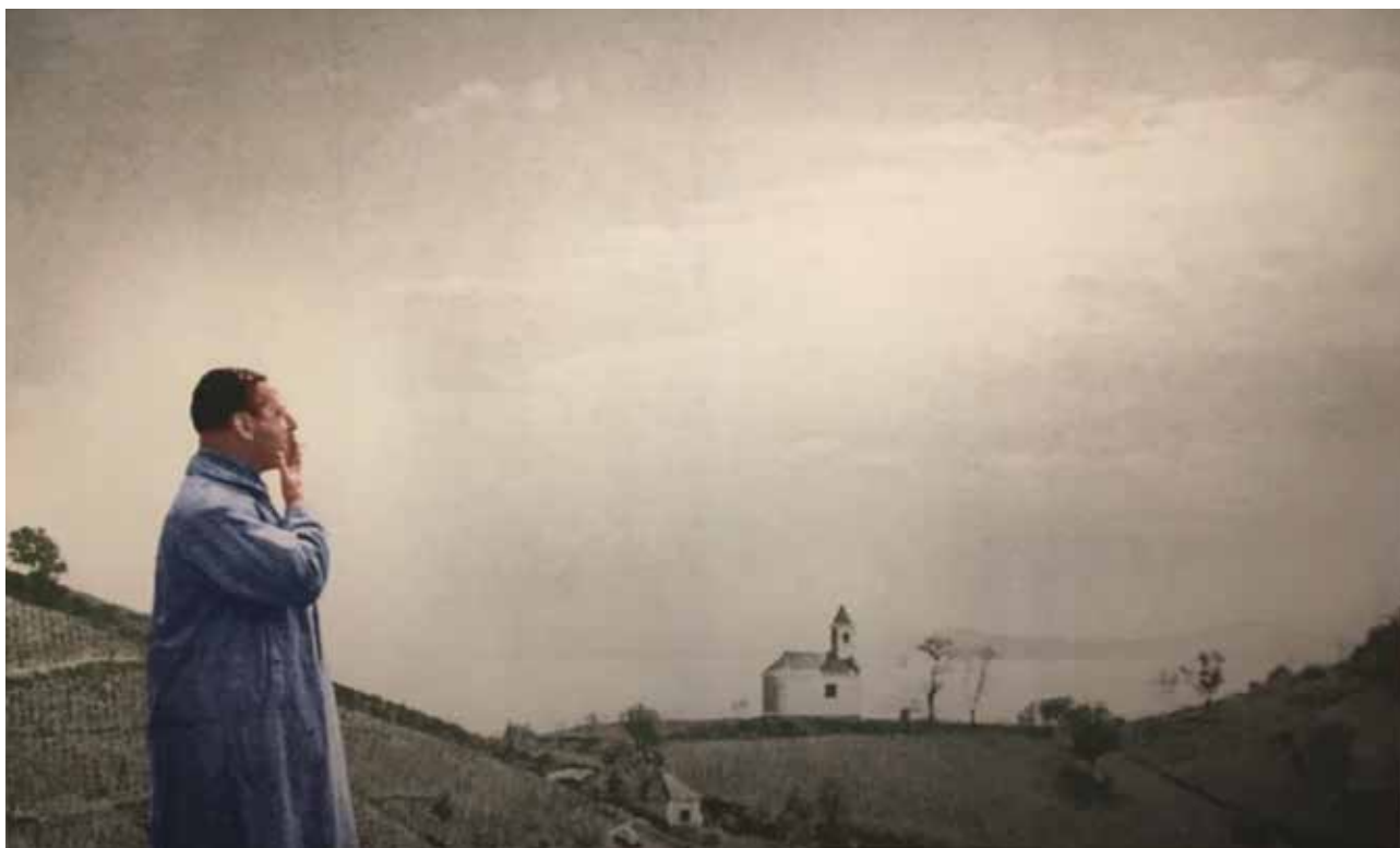
Farkas István Szigligeten, 1940-es évek - ismeretlen fényképész, újrászínezett fotó

Farkas István-kiállítás a Magyar Nemzeti Galériában. A kiállítás március 1-ig tekinthető meg az MNG C épületében