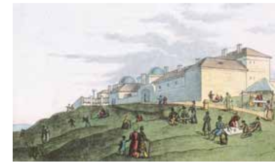
Gellérthegyi csillagvizsgáló, 1840

bécsi kongresszusról idelátogató uralkodók hivatalos programjába felvették a csillagda megtekintését. 1815 októberében ünnepélyes keretek között avatták fel az akkori világ egyik legmodernebb obszervatóriumát a „három császár” (a Szent Szövetség uralkodói: I. Ferenc magyar király és osztrák császár, I. Sándor orosz cár és III. Frigyes Vilmos porosz király) jelenlétében. A korábbi gyakorlattól eltérően a gellérthegyi csillagvizsgáló alaprajza hosszúkás téglalap volt, a földszintes észlelőterem mellett egy-egy kerek toronnyal, rajtuk forgatható bádogkupolával. A termet átszelő, észak–dél irányú réseken át figyelhették meg a