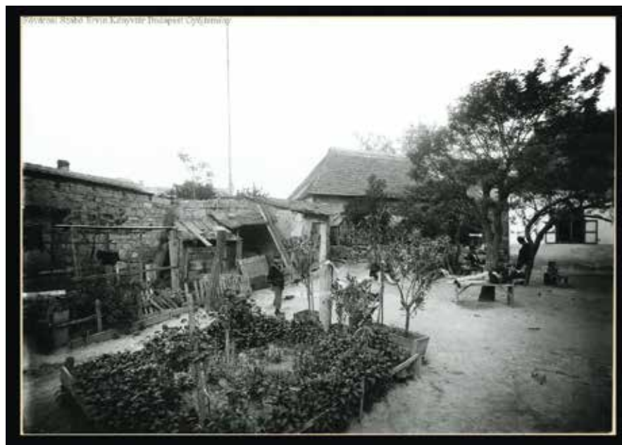
Vendéglő a Nagy szederfához – Sánc-Domb sarok