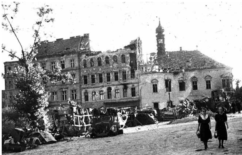
Szemben a Tárnok utca – a sarkon a régi budai városháza mellette a 26.

A Tárnok utca már a középkorban is Budavár egyik ütőere volt számos kereskedőházával, amelyeknek a földszintjén üzlethelyiségek sorakoztak. Az oklevelekben és a Budai Jogkönyvben – kilenc kofa árupadját találtuk megszabott rendben – a „Boltosok utcája” vagy a „Fűszeresek sora” néven említik. Csak később, a 15. sz. második felében és a 16. században szerepel Szent György utcaként. „Kétségtelenül a középkori Boltosok-utcája volt Budavárának legmozgalmasabb utcája, egyik oldala csupa bolt, a másik bódé és kofa-áruhely, csupa boltos és kereskedő lakik itt, de annak a törzsökös budai polgárságnak jó része is, amelyik esküdtek és bírák képében a városhatalmat birtokolta.” Ezek a boltházak a funkciójuknak – árusítás – megfelelően épültek fel. Keskeny telkeken, aránylag zárt helyen, a Tárnok u. és az Úri u. közti tömbben maradtak meg egymás mellett sorakozva. Földszintjükre jellemző a félköríves vagy szegmentíves ablakok használata, amelyek jellemzően az árusítást