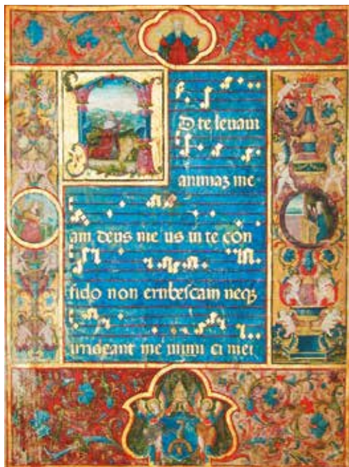
Bakócz graduálé címlapja