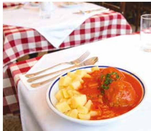
Klasszikus készétel: paradicsomos húsgombóc főtt burgonyával