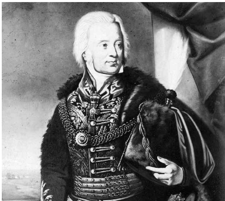
gróf Brunszvik József