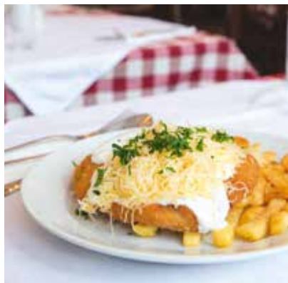
Nyitrai csirkemell fokhagymás tejföllel és reszelt füstölt sajttal: a népszerű fogások egyike

– A kisvendéglőben ugyanis nem tör ki a botrány, ha a jóízű ebéd közben a pörköltzsajt véletlenül az abroszra csöppen – meséli. – Jó pár évig laktam a XIII.