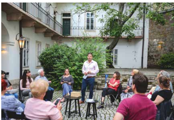
Mondj te is egy verset!