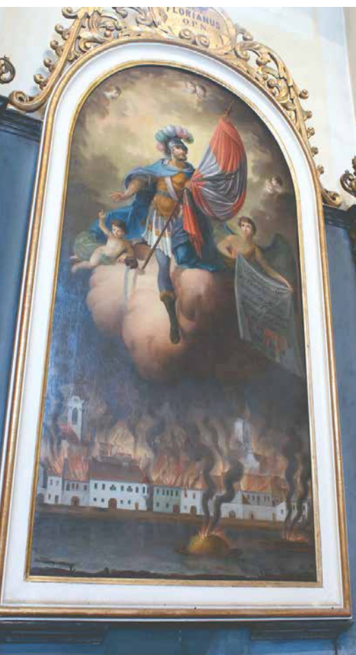
A tabáni tűzvész az Alexandriai Szent Katalin Plébániatemplom egyik festményén