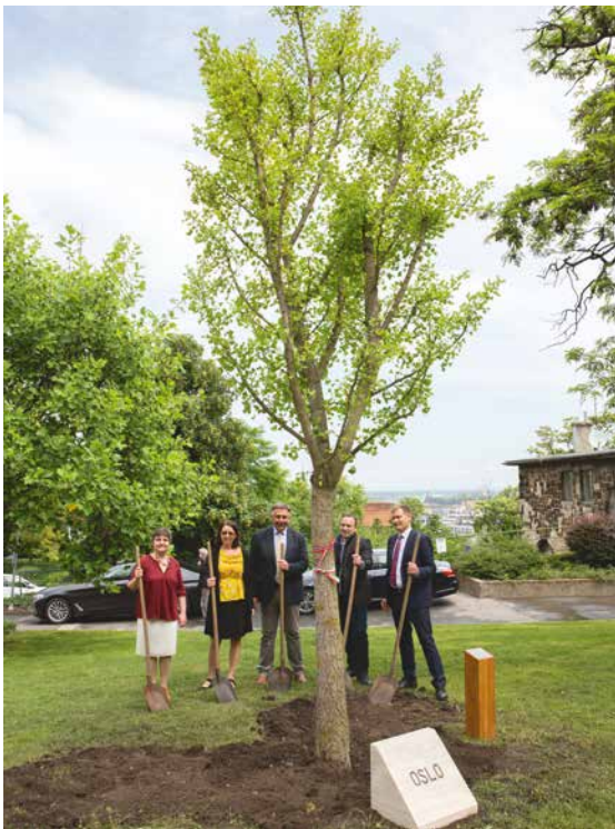
Faültetés az Európa Ligetben