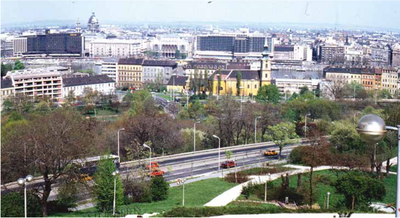
1984., kilátás a gellérthegyi víztározótól a Tabán és a Belváros felé.

1966-ban, az Eszperantó Világkongresszus alkalmával helyezték el az eszperantó emlékművet és kutat a Ráczi fürdő közelében. Kőfalvi Gyula és Pfannl Egon munkáit egy közadakozásból emelt Ludwig Zamenhof szobor egészíti ki – Zamenhof volt az eszperantó mozgalom megteremtője. Az Apród utca 10. előtt Virág Benedek emlékére állítottak szobrot, mellette a Tabán Társaság emléktáblájával. Az egykori Kereszt tér helyét ma is könnyű megtalálni, csak a keresztet kell megkeresni a domboldalban. Felette egy 1956-os emlékmű áll. A híd lehajtójának közelében egy faragott szikladarabon az Ördög-árokra emlékeztető szöveget olvashatunk. Egykori munkahelyének, a Semmelweis Orvostörténeti Múzeumnak a szomszédságában állították fel Antall József miniszterelnök mellszobrát 2003-ban. A Fogas utca és a Döbrentei utca sarkán pedig