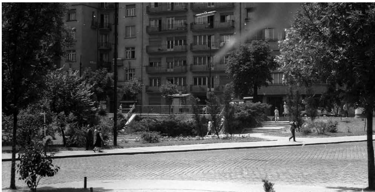
1963., Alagút utca-Pauler utca sarok, szemben a Krisztina körút házsora

Jó látni, hogy a lakóhelyünk folyamatosan fejlődik, szépül, de jó néha előkaparni morzsákat a múltból, kicsit megállni, emlékezni, felidézni a múlt ízeit, illatait, hangulatait.