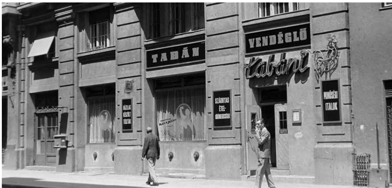
1966., Budapest, I., Attila út 27., Tabáni Kakas vendéglő

Az ételeknek is egész más illatuk volt, mint otthon – az óvodai, majd napközis étkeztetés szag- és ízvilágát nem tudja elfelejteni az, aki éveken át részesült a bableves, tejbegríz, töpörtyűkrémes kenyér, finomfőzelék, paradicsomos káposzta, sült hús és hasonló menük kínálatából.