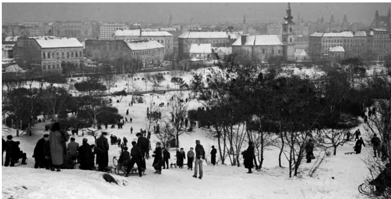
1956., Szánkózás a tabáni dombon

A kiskamaszkori éveim meghatározó élménye a testvérem megszületése volt, akinek gyorsan a „pótmamája” lettem, lévén 11 év a különbség kettőnk közt. Az ő gondozása közben ismertem meg azt a bizonyos, jellegzetes kisbabail-