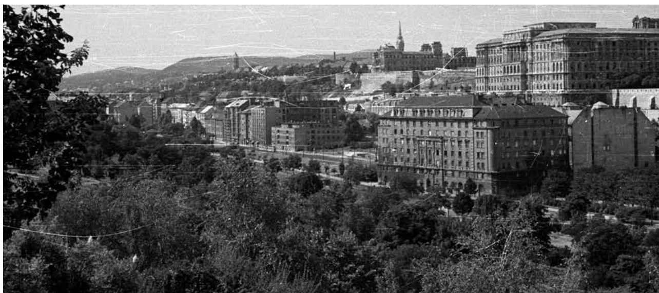
1959., kilátás a Gellért-hegyről a budai Vár felé, előtérben a Bethlen-udvar

5 éves koromtól a nagyszüleim már nem velünk éltek, így óvodába kellett járnom. Az óvoda az Attila úton működött, reggelente a Vérmező szélén siettünk a villamostól Anyukámmal. Ahányszor eszembe jutott életem során, hogy hány sötét, esőszagú reggelen trappoltunk azon az úton, mindig megborzongok, és látom magam előtt, ahogy lépkedek át a tekergető giliszták fölött, szomorúan, szorongva az idegen környezet, az otthon melegének, nyugalmanak megszűnté, a családdal töltött idő pár órára csökkenése miatt.