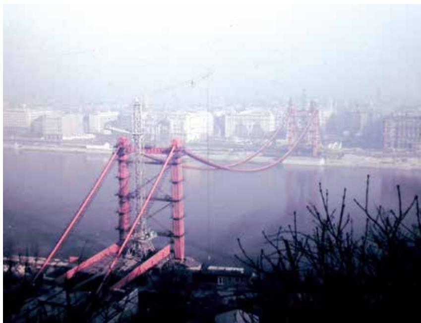
1963., az épülő Erzsébet híd a Gellért-hegyről fotózva.