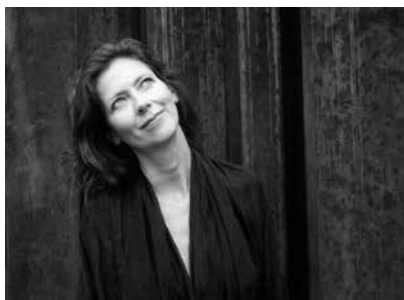
Fotó: Flor Garduño

KÁROLYI KATALIN ÉS VENDÉGEINEK KONCERTJE