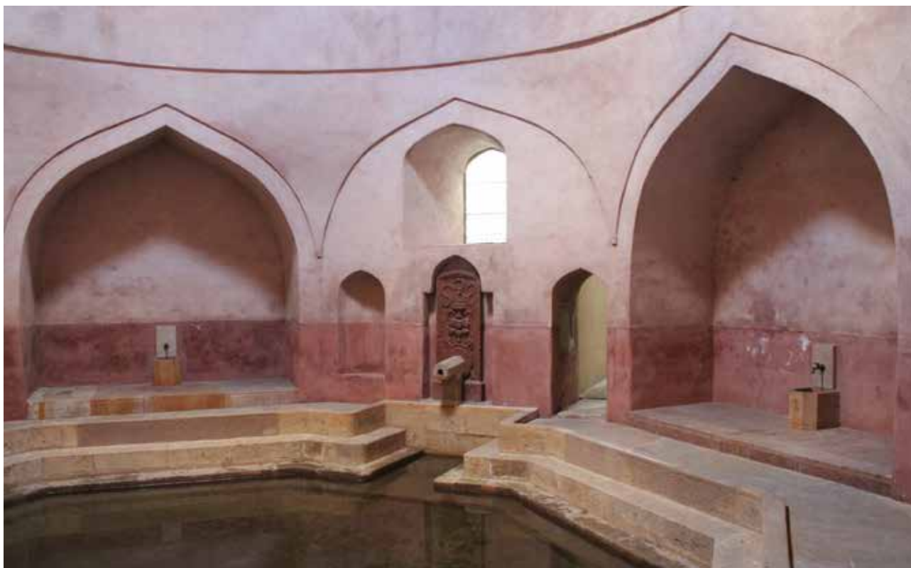
A törökök téglaport keverték a vakolatba

tésekor elfalazták. A belépés előtt érdemes megnézni a helyreállított régi feliratokat is az egyik kapu felett: STEIN (kőfürdő), WANNEN (kádfürdő), DAMPF (gőzfürdő), MINERAL (ásvány-, gyógyfürdő), EISEN (vasfürdő).