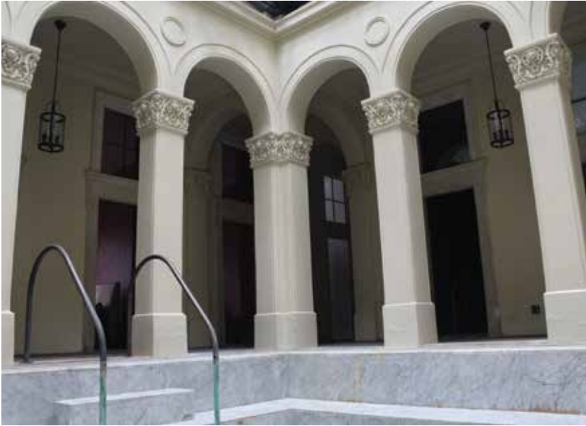
Az egykori Flóra-fürdő lesz a VIP-részleg • Fotó: a szerző felvétele, 2016

sziklafal tehát a mai kor termékei, de Ybl tervezői szellemének örökösei. Egyetlen darabka – az egyik szobor egy része – mondható csak eredetinek. Különleges látványt nyújt a vállaltan kortárs külső héj is: a kidomborodó félgömbök vasbeton szerkezete látható maradt. A zuhanyokra nem kerültek csaptelepek, a víz folyását az indítja be, ha a vendég rálép az alatta lévő vaslemezre. További érdekesség lesz, hogy az 1865-ben jellemző, a mainál jóval alacsonyabb víznyomást is „újjaépítették” a zuhanyzóknban.