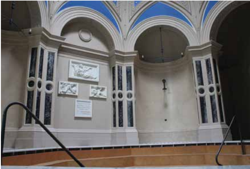
A langyos medence betétes oszlopai és égbék festése • Fotó: a szerző felvétele, 2016

hagyták. Így télen úgy fürödhetünk majd a medencében, hogy közben némán szállingózik be egy kis hó is. Ez a fürdőterem szellőzését is frap-