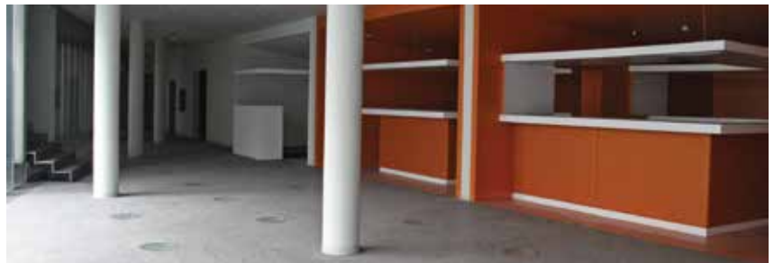
A modern tereket meghatározó, háromszögű rácsszerkezet

után is megmaradt, csak helyreállításra, felújításra volt szükség.