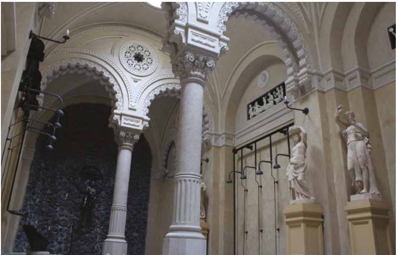
A zuhanycsarnok 2016-ban

Az egykori Ybl-féle zuhanycsarnok a második világháború idején bombatalálatot kapott, majd a hatvanas években elbontották. (Úgy tüntették el Ybl egyik alkotását, hogy közben már létezett az építésszakmában az Ybl-díj!) A zuhanycsarnok és a langyos fürdő 15 cm vastag vasbeton falazattal születte meg újra, itt tehát nem egy régi épületrész tatarozásáról beszélhetünk, hanem egy régi épület újbóli megidézéséről, néhány méterrel távolabb az eredeti helyétől. (Ha az eredeti helyén épült volna vissza, akkor belógott volna a szálloda terébe.) Berendezését régi képek alapján alkották meg újonnan. A hatalmas rózsájú réz zuhanyok, a meleg-vízartályok, a háttért adó mű