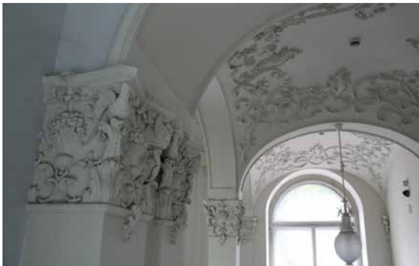
A barokk bejárati épület belső tere • Fotó: a szerző felvétele, 2016

A török medencék közül kettő megvan, a nagyobb fölött még az eredeti kupola is. Ezt a kupolát a mostani rekonstrukció szabadította ki a ráépítések alól, így újból megismerhetjük az eredeti falazat. A kisebb medence fölött pedig rekonstruálták az 1905-ben elbontott kupola ívét. Dévényi Tamáséknak az volt a tervük, hogy a régi korokat fáklyás világítással idézzék fel újra, erre azonban nem kaptak engedélyt, így a fáklyák helyett végül vízálló elektromos lámpákat terveztek ide. Kíváncsian várjuk, hogy az ötlet a megnyitás után megvalósul-e. Az is merész döntésnek bizonyult, hogy a kupola tetején lévő kerek nyílást, azaz opeiont a török kornak megfelelően nyitva