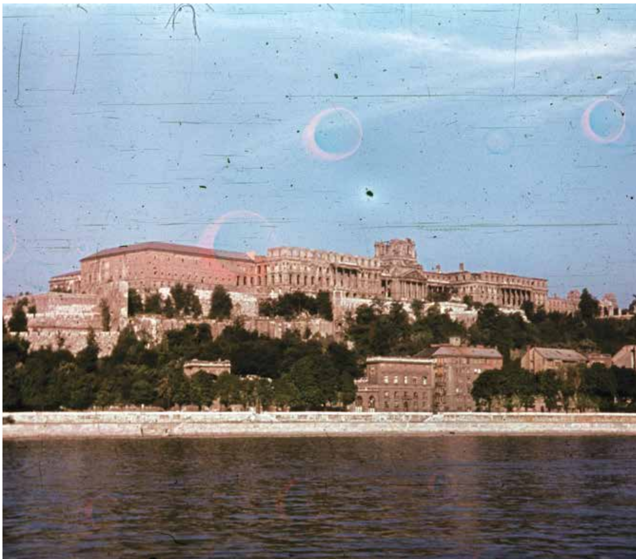
1955 körül: a házsor is eltűnt, és a Vár kupolája is.