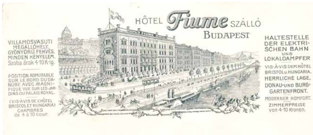
Korabeli hirdetés

A Lánchíd utcában páratlan házsámok sorakoznak egymás után – de hova lett a páros oldal? Sétánkat a Lánchíd utca 12. alatt egykor állott szállodával zárjuk.