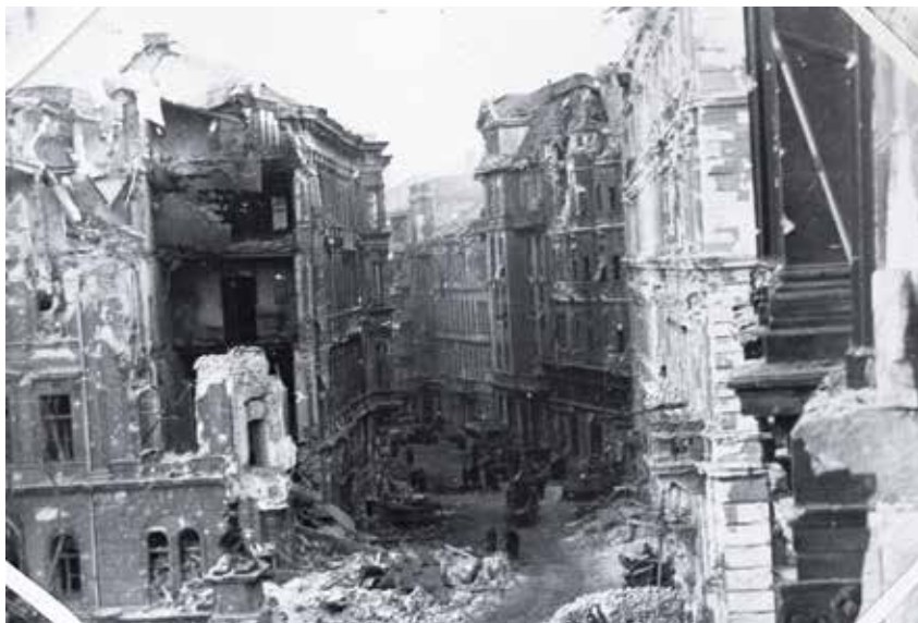
Lánchíd utca, 1945

Idővel a Fiume varázsa megkopott, másodosztályú szállodává vált. Forgalmát még biztosította, hogy előtte kötöttek ki a gőzhajók a Csepel-sziget falvai vagy a Dunakanyar felé tartva. A huszadik század elején már egyenesen azt írta