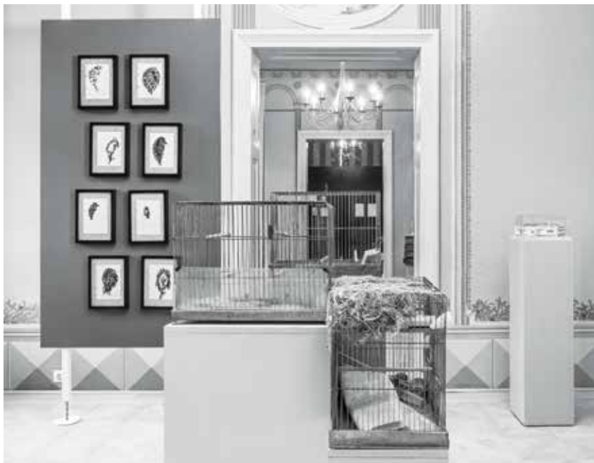
Hiányzásra kijelölt hely • Fotó: Szilágyi Lenke