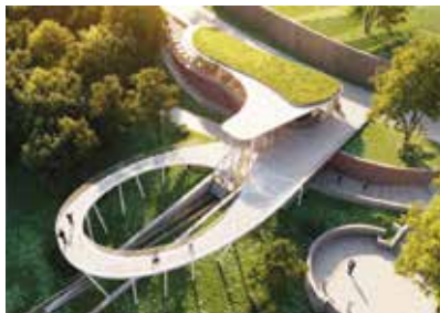
Látványterv 2009-ből

A beruházás céljára létrehozták a Rác Sikló Kft.-t, amelynek a Budapest Gyógyfürdői és Hévízei Rt. (BGYH) kezében lévő 25%-nyi résztulajdonát a BKK vásárolta meg 2013-ban, az építkezés közlekedésszakmai kapcsolatára hivatkozva. A 300 méter hosszú pályát az Orom utca vonaláig a hegy belsejében haladva tervezték meg. Az alsó