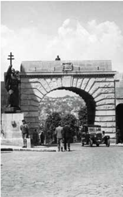
Az új Bécsi kapu 1936 körül • Fotó: fortepan.hu/Friss Ildikó

miaalkotás. Az alkotás az itteni Ostrom utcára utal, a járdáról nehezen kibetűzhető felirata: „neve Buda vára ostromának emlékét őrzi”. Valóban, a közeli várfalszakaszon törtek be először a vár területére 1686-ban.