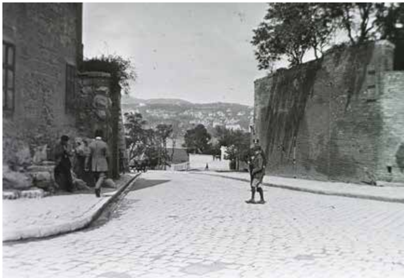
Az 1910-es évekre datált felvételen semmilyen kapuépítmény nem látható

A középkori kaput a török kor után, 1723-ban újabbal váltották fel. Ezt 1850-ben cserélték le egy következőre, de ez elég rövid életűnek bizonyult: már 1896-ban, a milleniumi ünnepségek évében elbontották. Több évtizeden át nem állt itt semmilyen kapuépítmény.