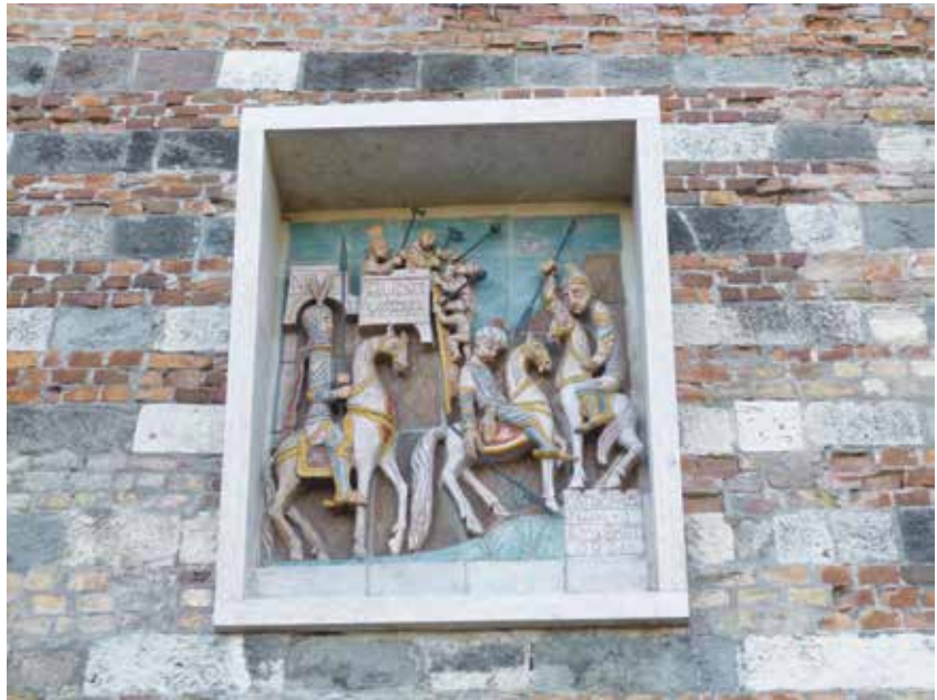
Kovács Margit kerámiaja

Szerencsés elhelyezésének, a fal mélyébe süllyesztésnek köszönheti jó állapotát a kapu külső oldalán, a várfalon elhelyezett Kovács Margit-kerámia-