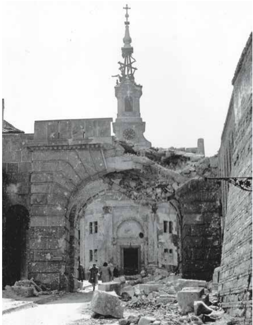
Második világháborús sérülésekkel