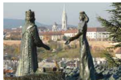
Kilátókó szobor

Az egyesület várja az érdeklődőket áprilisi klubnapjára. A nap témája: