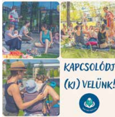
Baba-mama Klub.

Ha (ki)kapcsolódnál vagy szabadon beszélgetnél támogató közegben, itt bátran kérdezhetsz. Cseréj tapasztalatot másokkal a kisgyermekes lét örömeiről, kihívásairól! Babahordozás, szoptatási tanácsadás, mosható