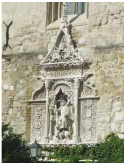
A budapesti Mátyás-dombormű

De hogy került oda a dombormű? 1920-ban, Budán alakult meg a Hollós Mátyás Társaság, írók, tudósok, művészek részvételével. Céljuk Mátyás örökségének ápolása, kultúrájának bemutatása volt. Tervbe vették, hogy megjelölnek minden olyan épületet, ahol Mátyás megfordult, ezért felfigyeltek a Műemlékekre Felügyelő Bizottság javaslatára, és támogatták a bautzeni emlék másolatának felállítását. Ekkorra Lux Kálmán már újra is