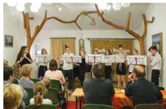
Farkas Ferenc Zeneiskola