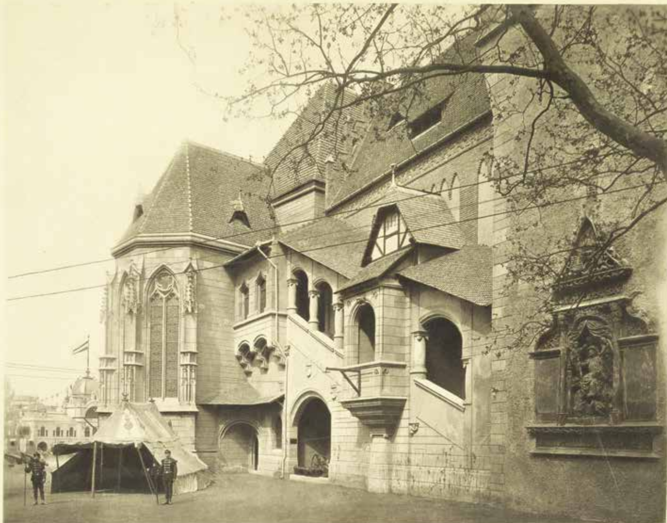
A Vajdahunyad-vár egyik oldalfala 1896-ban Klösz György felvételén • Fotó: Fortepan/Budapest Főváros Levéltára

A Hilton szálló két nagy tömbje közé egy régi torony ékelődik. Rajta egy nagy méretű dombormű őrzi Hunyadi Mátyás dicsőségét.