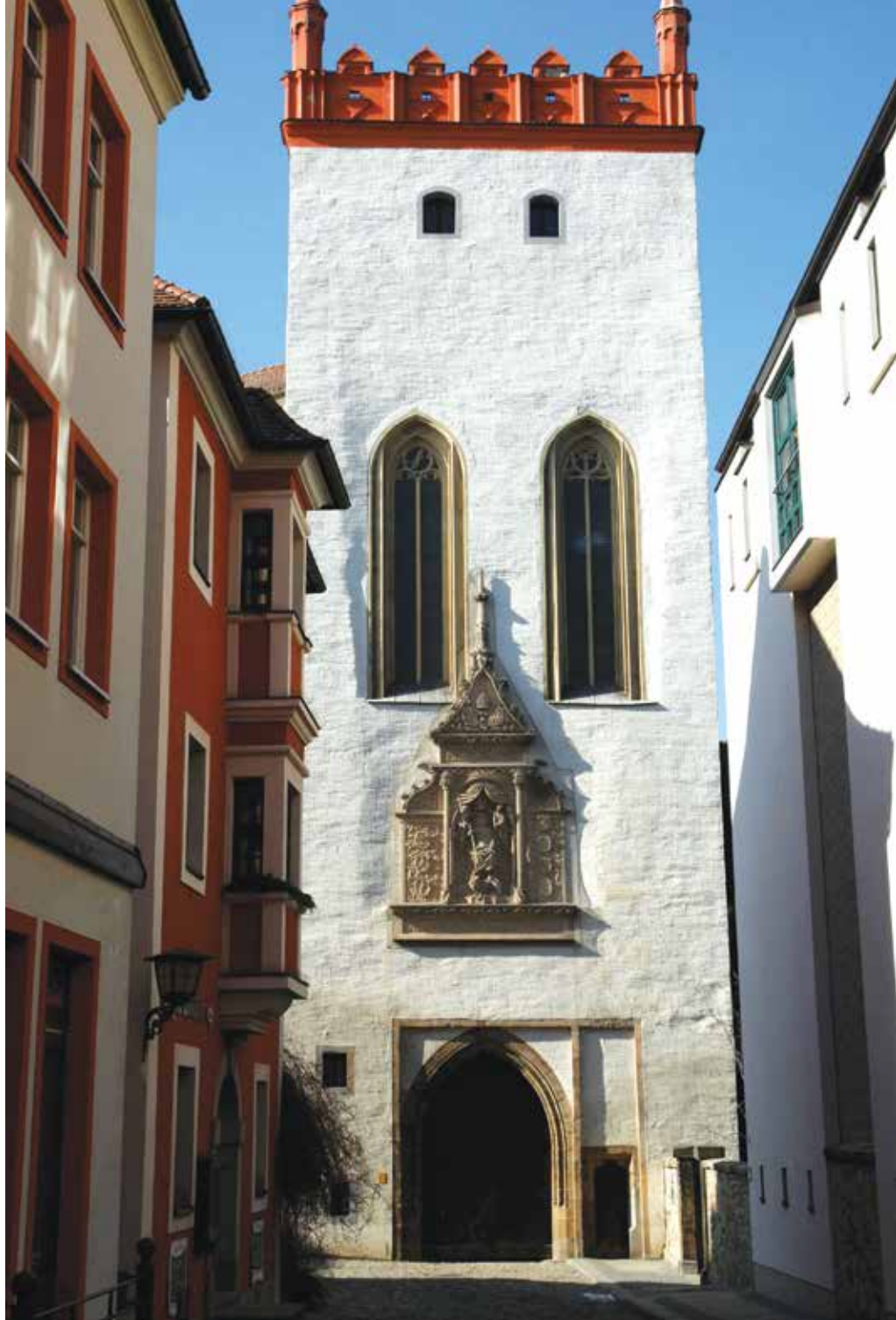
Bautzen, az Ortenburg Mátyás-tornya

faragtatta az 1896-os Ezredéves Országos Kiállításra készült másolat gipszöntvényét, sőt, a hiányzó címereket is pótolta. A mű felavatására 1930-ban került sor.