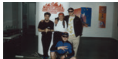
Fotó: Ganz Albert

Kiállító művészek: Czerneci Tamás, Fazekas Dániel, Góth Martin, Nyíri Orsolya