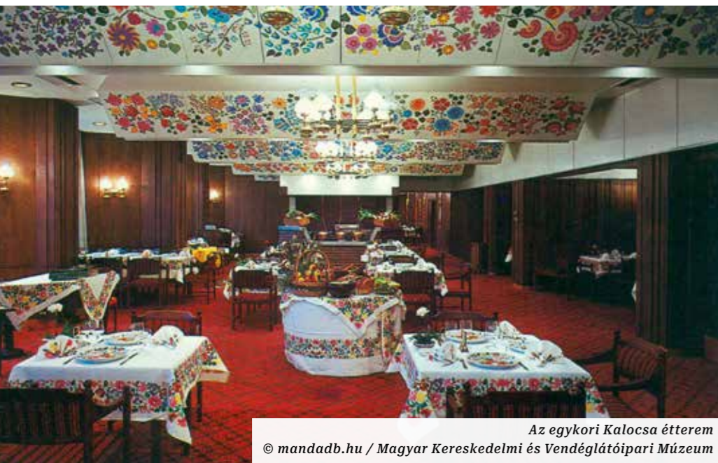
Az egykori Kalocsa étterem