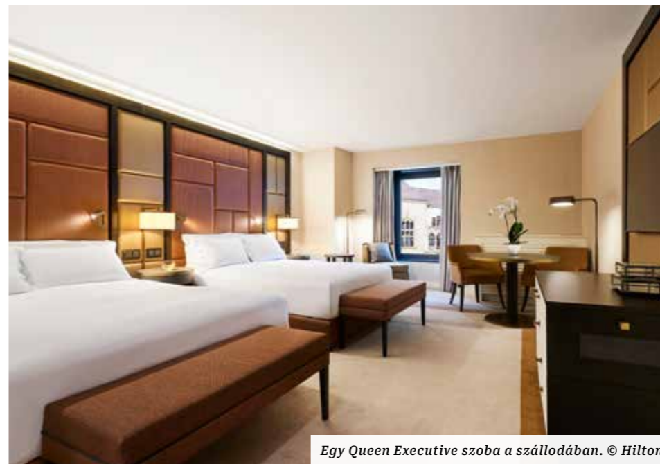
Egy Queen Executive szoba a szállodában.

A szállodák életében megszokott, hogy rendszeresen felújításokra, átépítésekre kerül sor. 2005-ben a recepció terét újították fel, a Panorama Hall helyén bárt alakítottak ki, átköltöztették a ruhatárat és akadálymentessé tették a két épület-szárny közötti összeköttetést. 2016-ban adták át a Hunyadi János útról nyíló kiágazást és buszfordulót, azóta egy „barlangon” keresztül, lentről is könnyen be lehet jutni a szállodába. 2017-re újult meg a Bálterem és a négy különterem, valamint négy kisebb terem is építettek. Elkészült a szobák felújítása is. A legújabb építkezés pedig 2020-ban kezdődött, a szálloda tetején egy 430 négyzetméteres tetőbár épült. A szálloda 2022-ben fővárosi védettséget kapott.