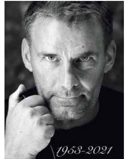
Fotó: Rákoskerti László

A kerületben élt Rákoskerti László fényképész, számos reklám és divatfotó alkotója augusztus 22-én lenne 69 éves. A tiszteletére rendezett kiállításon az érdeklődők az alkotó gazdag életművéből láthatnak egy szubjektív válogatást. „ Nem fotóművész vagyok, hanem alkalmazott fotográfus! ” – mondta, képei mégis művészi igényességűek voltak, bár kiállítás formájában eddig nem láthatta őket a közönség.