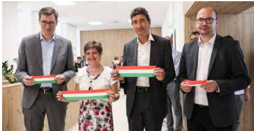
A felújított Attila úti rendelő átadásakor 2021. július 9.

Itt is szeretném felhívni a figyelmet, hogy önkormányzatunk kezdettől azért dolgozik, hogy a családok kiszolgáltatottságát csökkentsük és a klímataudatosságot erősítsük. Ezért már két éve létrehoztuk azt a pályázati támogatási rendszert, amellyel a lakások energiahatékonysági korszerűsítésére ösztönözzük a kerületi lakókat. Idén nyáron tovább könnyítettünk a feltételeken, az igénylők jövedelmi határát fölemeltük, vagyis többen lettek jogosultak,