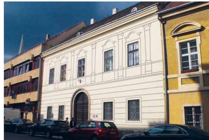
Tárnok utca 7. (a szerző felvétele, 2022)

Tárnok utca 11: A 16. században épült két középkori ház részleteinek megőrzésével a barokk korban emelt ház állt itt