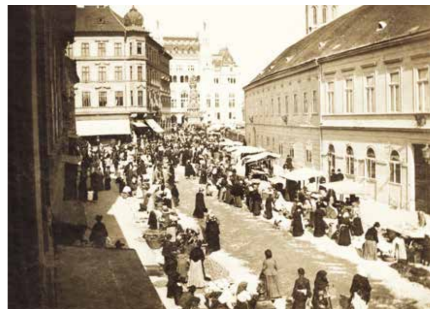
A Tárnok utca 1905 körül