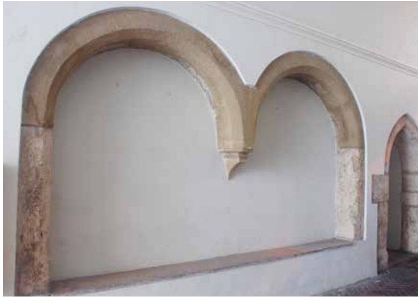
Félköríves ülőfülke az Úri utca 38. kapualjának északi oldalán

A középkori Várnegyedet a Zsigmond-korabeli várpalotával együtt elpusztította Budavár visszafoglalásának 1686-os ostroma. Az ezt követő, barokk kori újjáépítés során igyekeztek felhasználni mindazt, ami még állva maradt – így maradtak ma is láthatók a gótikus ülőfülkék.