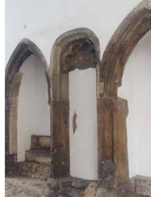
Két korábbi, később felfalazott csúcsíves ajtóvágat között álló íves ülőfülkedarab az Úri utca 32. alatt

dísztelenek. Erre példák: Szentháromság utca 7., Fortuna utca 5. kapualjának déli oldala, Úri utca 31., Úri utca 24. (északi), Országház utca 7., Országház utca 24. (déli), Úri utca 34., Úri utca 38. (északi), Úri utca 47. (északi), Úri utca 8. (déli), Hess András tér 4. (északi). Ezek a kapualjak a 14. század első felétől a 16. század végéig tartó időszakra datálhatók.