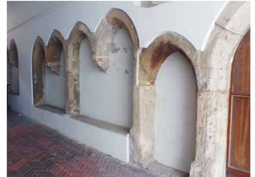
Egyszerű csúcsíves kialakítású ülőfülke az Úri utca 38. alatti kapualj déli oldalán

A lóhereíves, felső lezárású ülőfülkék a korábbiakból történt továbbfejlődés eredményei a gótikában. Az egyszerűbbek – például a Fortuna utca 13. kapualjának déli falában, az Országház utca 24. (északi), az Országház utca 20. (déli) – csak élsarkításos kialakításúak, míg profilos példá-