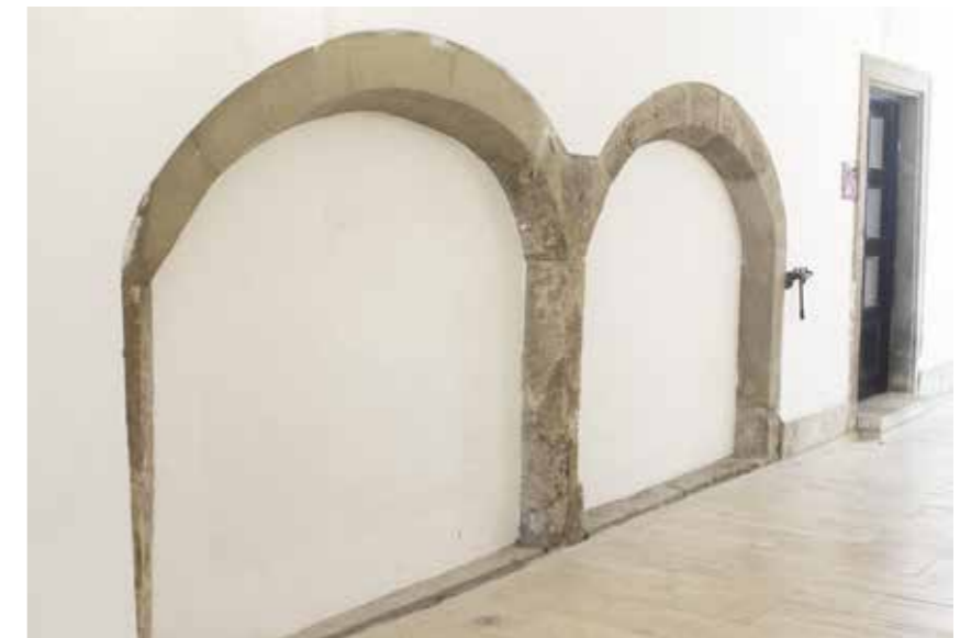
Az Úri utca 36. kapualjának déli oldalán található szegmensíves ülőfülkék